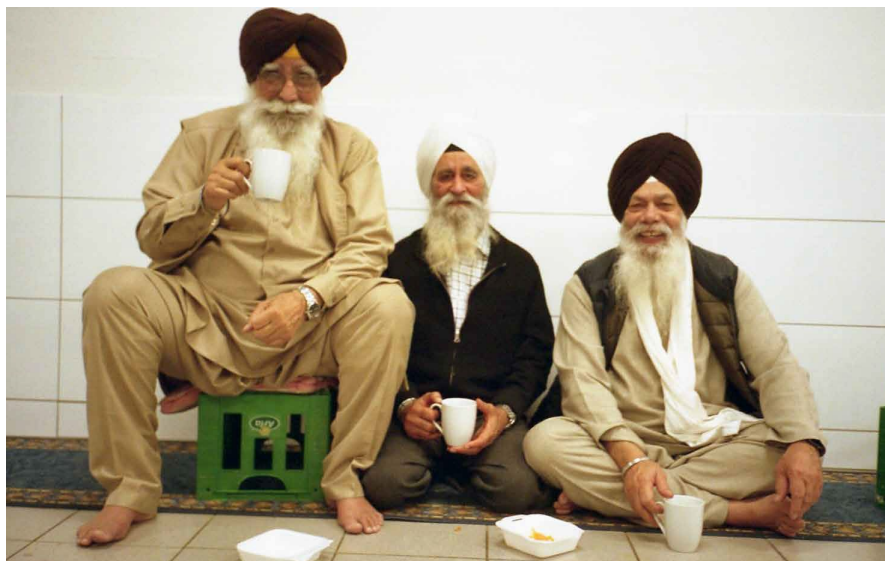
Ved indgangen til udstillingen blev brugerne mødt af et billede af repræsentanter fra sikh-samfundet i gurdwaraen i Vanløse. De samme personer vil byde gæsterne på Dokk1 velkommen i museets pop-up udstilling.

underliggende tone, dog uden nogensinde at være i fuldt fokus. Det gjaldt eksempelvis de udstillede genstande. På grund af pop-up udstillingens komprimerede format var der betragteligt færre genstande inkorporeret i udstillingsdesignet. Mens eksplicit religiøse materialiteter og immaterialiteter slet ikke var tænkt ind, kom visse implicit religiøse materialiteter og immaterialiteter til at eksemplificere kulturelle praksisser. Det gjaldt kirtaninstrumenter, turbaner, de fem k'er og gryden, som gennem fortolkende genstandstekster bandt historien om sikhernes kultur og traditioner sammen. Implicitte religiøse praksisser var desuden afspejlet i de udvalgte fotografier fra familievæggen, der som udstillingens ydre udtryk inviterede brugerne inden for i sikhernes univers.