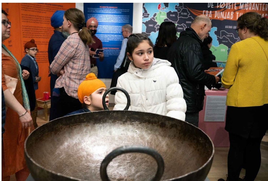
Som eksempel på levet religion blev gryden til fællesmåltidet langar tildelt en central plads i udstillingen.

Selvsamme partnerskabsdeltagere havde et ønske om, at en profilvæg med fem fremtrædende personligheder og fem vigtige fortællinger om sikh-samfundet skulle præsenteres i udstillingen. Flere genforhandlinger om de to elementers formål og indhold mandede til sidst ud i kompromisets kunst, hvor begge blev inkorporeret. Belært af tidligere erfaringer vidste vi, at pragmatiske mellemveje var et vilkår i en samskabende proces, og det blev ikke