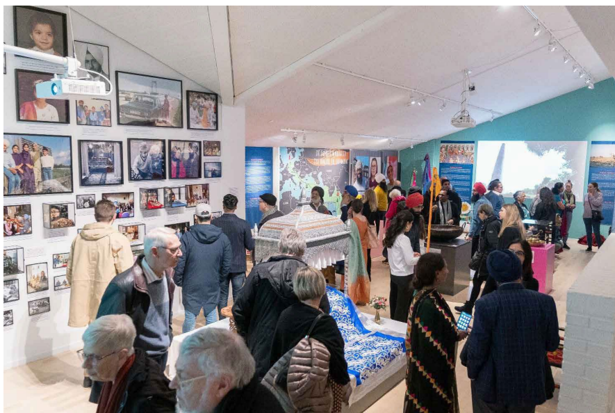
På åbningsdagen lagde både danske sikher og andre museumsbrugere vejen forbi.

Sammen med 300 besøgende slog Immigrantmuseet i februar 2020 dørene op til en ny særudstilling om en lille religiøs minoritetsgruppe. Sikkerne i Danmark – Meet the Sikhs var navnet på udstillingen, der gennem private fotos, genstande og livsberetninger fortalte historien om det danske sikh-samfund gennem de seneste 50 år. Med et fælles ønske om at formidle de danske sikhers migrationshistorie indgik Immigrantmuseet i sensommeren 2019 et nyt partnerskab med repræsentanter for det danske sikh-samfund, herunder organisationerne Sikh Ungdom, Øst Punjab Kul-