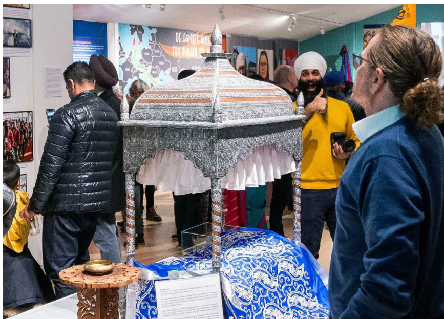
Palkien, der normalt rummer helligskriftet Guru Granth Sahib og står i én af gurdwaraerne, vakte opmærksomhed blandt de besøgende.

Udstillingsrummet omkring palkien fik således karakter af at være et ‘sacred space’. Herved forstås, at religiøse elementer i kraft af deres højtidelige karakter er omgærdet af numinøs energi og derved påvirker det rum, som elementet er placeret i. Mens nogle brugere forstår elementet ud fra eksempelvis æstetiske eller historiske perspektiver, tillægger andre brugere elementet religiøs mening, hvorved deres adfærd omkring elementet ændrer sig (Reeve 2012, 133). Som eksempel blev blomster udstillet omkring palkien flyttet, rettet på og omarrangeret af mange forskellige repræsentanter fra sikh-samfundet, der alle ønskede at bidrage med deres egen forståelse af palkiens udtryk. Til slut fandt museet og repræsentanterne dog fælles fodslag i ønsket om, at palkiens praksisforankring skulle visualiseres. Vi valgte derfor at afspille en privatoptaget film fra gurdwaraen i Vanløse, der gav brugerne et indblik i religiøse handlinger under en gudstjeneste i 1982. Filmen sigtede således efter både at vække genkendelse blandt danske sikher som brugergruppe og samtidig demonstrere religiøse praksisser tilknyttet palkien over for andre museumsbrugere.