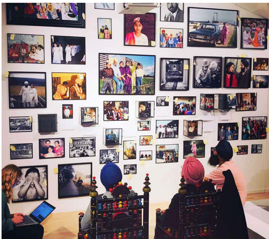
Samtalerne om de mange fotografier fra sikhernes private albums vakte minder og lysten til at dele egne historier.

Motiver af turbanbindinger og kirtanmusikere, af bryllupper og religiøse ceremonier i gurdwaraerne, af fællesbøn og meditativ recitation i hjemmet blandede sig med motiver af unge mænd ankommet til banegården, af en