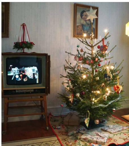
Illustration 3: Juletræerne står i henholdsvis kernefamiliens og pensionistægteparrets lejligheder i 1974-bydelen. Der er mange lighedspunkter i brugen af julepynt, men der er også forskelle.

mange nuancer, “men det er lidt vildt, at det ikke ses” (Workshop, 2021). Det overraskede, at det udefra kan se ens ud. I forlængelse heraf blev det problematiseret, at hvis man skulle fremhæve alle nuancer, så ville der blive tale om en meget omfattende formidling i udstillingerne.