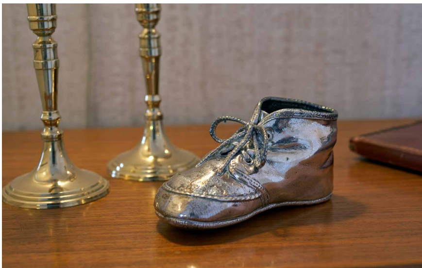
Illustration 1: Den forsølvede barnesko var i udgangspunktet udtænkt som et eksempel på en genstand, der skulle lede tankerne hen på barnedåb. Traditionen med forsølvede babystøvler viste sig ikke at være direkte knyttet til gavegivning i forbindelse med dåb. Sølvskoen er ikke en del af museets faste udstillinger.

Det var hyggelige besøg, og alle havde en god oplevelse. Men samtalerne om levet religion blev ikke som forventet. Udstillingerne af hverdagshjem inviterede ikke af sig selv til samtaler om levet religion. Modsat hvad man kunne antage, så inviterede et fotografi af et brudepar, hvor bruden var klædt i hvidt og gommen i sort jakkesæt, ikke specielt til at tale om bryllupper, for det fyldte ikke hos gruppens deltagere. Den efterfølgende dialog over udvalgte genstande viste, at her var det også svært at føre samtaler om levet religion. En vielsesring fik samtalen ind på ægteskab, men det var med fokus på det praktiske: at kunne få en lejlighed, og derfor en hurtig tur på rådhuset. En plejehjemsbeboer fortalte, at hun og hendes søster var blevet gift samtidig, fordi det var mest praktisk.