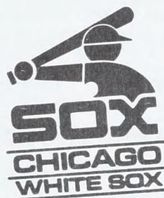
Chicago White Sox

(73) Indehaver: Major League Baseball Properties, Inc., a corporation of the State of New York, 350 Park Avenue, New York, New York 10022, USA