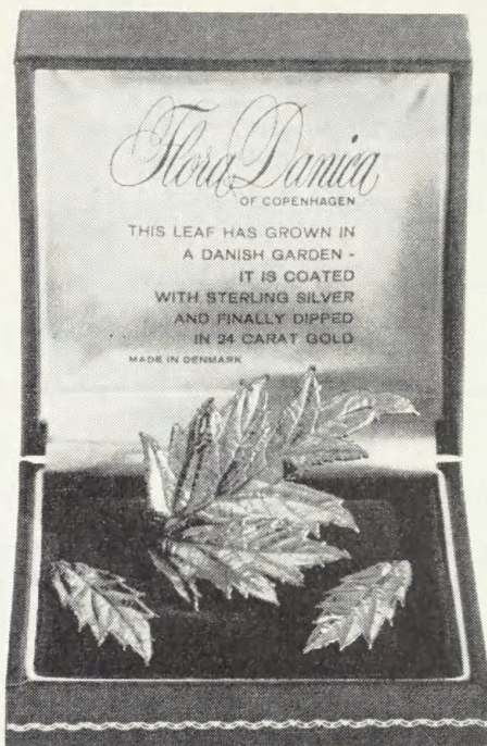
ALWAYS PRESENTED IN THE ORIGINAL GREEN CASES