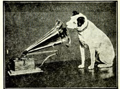
HIS MASTER'S VOICE

Reg. 1948 nr. 1217. Anmeldt den 29. juli 1948 kl. 11 30 af The Gramophone Company Limited, fabrikation, Hayes i Middlesex i England, og registreret den 4. september s. å. for televisions-apparater og dele deraf med tilbehør til samme. — Som fuldmægtig er anmeldt: Dansk Patent Kontor A/S, København.