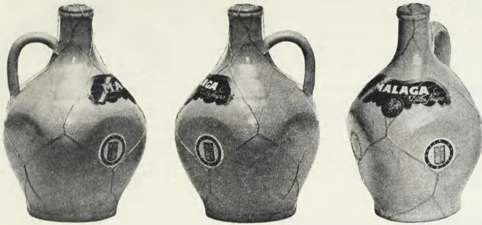
Reg. 1941 Nr. 516. Anmeldt den 6. December 1940 Kl. 11 45 af samme, og registreret den 14. Juni 1941 for Vin og Spirituosa. Ved Registreringen er der ikke begært Eneret til den blotte Anvendelse af Staaltraadsfletning.