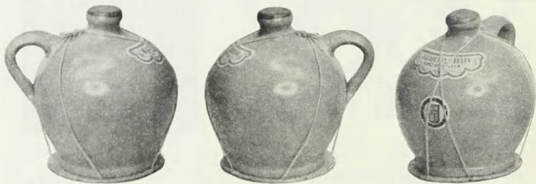
Reg. 1941 Nr. 514. Anmeldt den 6. December 1940 Kl. 11 45 af samme, og registreret den 14. Juni 1941 for Vin og Spirituosa. Ved Registreringen er der ikke begært Eneret til den blotte Anvendelse af Bastbaand.