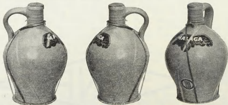
Reg. 1941 Nr. 515. Anmeldt den 6. December 1940 Kl. 11 45 af samme, og registreret den 14. Juni 1941 for Vin og Spirituosa. Ved Registreringen er der ikke begært Eneret til den blotte Anvendelse af Bastbaand.