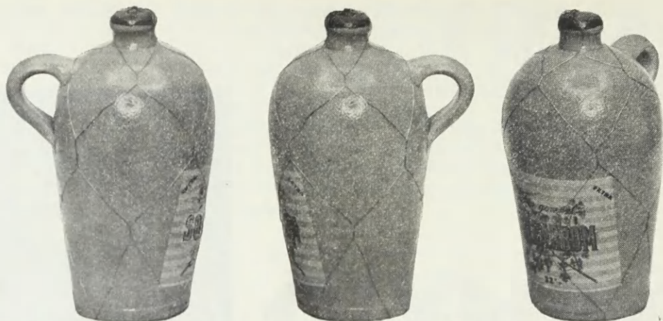
Reg. 1941 Nr. 513. Anmeldt den 6. December 1940 Kl. 11 45 af A.B.Olsens Vinhandel A/S, Vinhandel, København, og registreret den 14. Juni 1941 for Vin og Spirituosa. Ved Registreringen er der ikke begært Eneret til den blotte Anvendelse af Staaltraadsfletning.