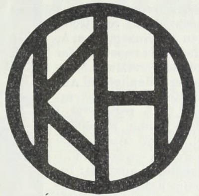
VÁLCOVNY PLECHU AKC. SPOL.

Reg. 1937 Nr. 1011. Anmeldt den 21. September 1937 Kl. 11 54 af Válcovny Plechu Akc. Spol. , Fabrikation, Prag i Czekoslovakiet , og registreret den 13. November s. A. Mærket er registreret for raa og delvis bearbejdede uædle Metaller, Blik og Blikvarer, Knivsmødevarer, Værktøj, Naale, emaillerede og fortinnede Varer, Jernvarer, Klejnsmede- og Smedevarer, Laase, Beslag, Metaltraad og Metaltraadsvarer, Ankre, Kæder, Staalkugler, Staalvarer, Valseværks- og Støberiprodukter. Derimod omfatter Registreringen ikke Hestesko. Mærket er i Henhold til Anmeldelse af 20. August 1937 registreret i Prag under Nr. 60735 bl. a. for ovennævnte Varearter. — Som Fuldmægtig er anmeldt: Ingeniørfirmaet Budde, Schou & Co., København.