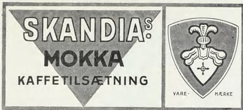
Schous Mokka Kaffetilsætning.

Reg. 1935 Nr. 298. Anmeldt den 20. Februar 1935 Kl. 11 53 af A/S Kaffesurrogatfabriken Skandia, Fabrikation, København, og registreret den 23. Marts s. A. I en aflang, gul Etikette ses to af røde Linjer begrænsede, rektangulære Felter, af hvilke det venstre er dobbelt saa bredt som det højre. I det venstre Felt ses en rød, ligebenet Trekant, der vender Spidsen nedad, og tværs hen over hvilken med gule Bogstaver staar Ordet: Skandia's . Herunder staar med sorte Bogstaver Ordet: Mokka og Ordet: Kaffetilsætning . I Feltet til højre ses et rødt Skjold omgivet af en gul og en sort Linje. I dette Skjold ses et gult Vaabenmærke. Under Skjoldet staar Ordet: Vare-Mærke . Henunder begge Felter staar med sorte Bogstaver Ordet: Schous , med røde Bogstaver Ordet: Mokka og med sorte Bogstaver Ordet: Kaffetilsætning . Mærket er registreret for Kaffetilsætning og Kaffesurrogater.