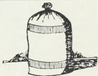
Urter og Urtetilberedninger

Reg. 1928 Nr. 402. Anmeldt den 29. December 1927 Kl. 10 af Ireks A.-G., Kulmbach, Ølbryggeri, Kød-varefabrikation og Fabrikation af andre Nærings- og Nydelsesmidler, Kulmbach i Tyskland, og registreret den 7. April 1928. En fyldt Sæk. Mærket er i Henhold til Anmeldelse af 13. December 1924 registreret i Berlin den 2. Juli 1925 for Kaffe, Kaffesurrogater, Kunsthonning, afskallet og afdampet Korn, Mel og andre Mølleriprodukter, Produkter af Kornfrugter og Frø, Næringsmel, Bagemel, Ris og Ristilberedninger, Suppestoffer og- tilberedninger, Forretter, Dejgvarer, Urter og Urtetilberedninger til Krydderibrug og andre Krydderier til Mad.