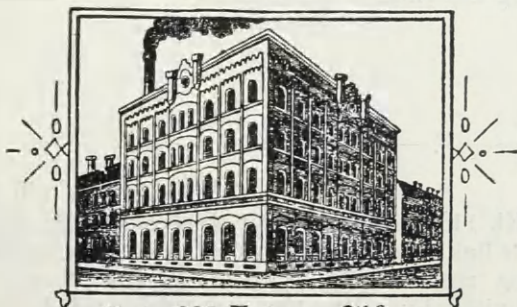
Art 633 Extra No. Mtr.

Reg. 1926 Nr. 650. Anmeldt den 3. Juli 1926 Kl. 11 57 af L. E. Toelle Nachfg., Gummibaand og Gummilidsefabrikation, Barmen i Tyskland, og registreret den 17. s. M. I en af en rektangulær Ramme omgven Etikette ses en Fabriksbygning. Paa Rammens to Sider ses Ornamente og under den staar: Art 633 Extra No. Mtr. Mærket er i Henhold til Anmeldelse af 12. December 1905 registreret i Berlin den 23. Februar 1906 for Eisengarn-Gummilidser. Anmeldelsen er senest fornyet den 7. December 1925. Den 19. Januar s. A. er der tilført det tyske Varemærkeregister, at Anmeldernes Navn er ændret til det her angivne.