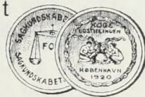
GULD MEDAILLE KOGEKUNST UDSILLINGEN 1920.