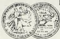
SØLV MEDAILLE KOGEKUNST UDSILLINGEN 1908.