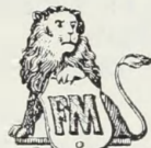
HØJESTE UDMÆRKEELSE KOGEKUNST UDSILLINGEN 1919