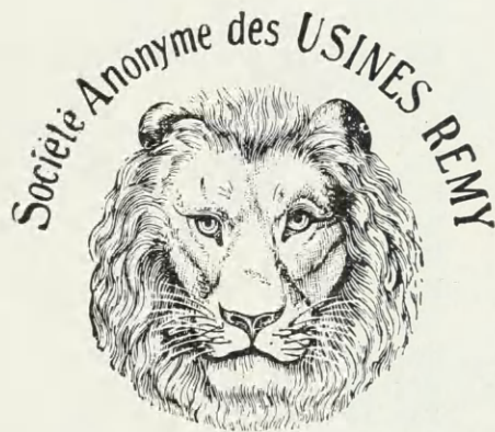
Marque de Fabrique (Dépose)

Mærket er i Henhold til Anmeldelse af 25. Maj 1920 registreret i Louvain for Stivelse af alle Arter og Former, hidrørende fra Ris, Hvede, Majs, Kartofler etc., Stivelseprodukter af alle Arter, Brødmel og lignende af alle Arter Kornsorter, alle Arter Næringsmidler for Mennesker og Dyr, Derivater af Ris, Hvede og andre Kornsorter samt Afald ved Fabrikation af Udtræksprodukter af Ris, Hvede og andre Kornsorter, ligeledes Gluten (Protein), alle Arter Oljekager, Semouler, spiselig Dejj, Produkter til Brug ved Vask og Appretur.