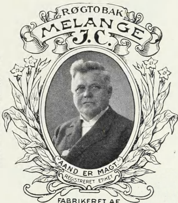
FABRIKERET AF F. C. BENDIXSEN THISTED & KØBENHAVN

Reg. 1923 Nr. 36. Anmeldt den 24. Oktober 1922 Kl. 11 5 af F. C. Bendixsen , Cigar- og Tobaksfabrikation, Thisted, og registreret den 20. Januar 1923. Folketingsmand I. C. Christensen i oval Ramme under et Baand, hvorpaa staar: Røgtobak Melange og: I. C. Rammen , paa hvilken forneden staar: Aand er Magt , er forneden og paa Siderne omgivet af Blade og Blomster. Forneden staar: Registreret Etiket . Fabrikeret af F. C. Bendixsen Thisted & København . Mærket er kun registreret for al Slags fabrikeret Tobak.