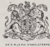
DE S. M. LE ROI D'ANGLETERRE

Reg. 1919 Nr. 133. Anmeldt den 6te Marts 1919 Kl. 11 55 af Veuve George Goulet & Cie., Handel med Champagnevine, Reims i Frankrig, og registreret den 15de s. M. Foroven ses i Guld, rødt og blaat tre Vaaben, nemlig til venstre et Skjold støttet af en Løve og en Enhjørning over Ordene: De S. M. Le Roi d'Angleterre, til højre et Skjold, støttet af to Løver over Ordene: De S. M. La Reine Des Pays-Bas og i Midten et Vaabenmærke, hvorover staar i en Bue: Fournisseur Breveté, over Ordene: De S. M. Le Roi D'Espagne. Under det sidste staar: Champagne. Tværs over Etiketten staar: George Goulet Reims. Mærket er i Henhold til Anmeldelse af 25de April 1911 registreret i Reims for Champagnevine, mousserende og ikke mousserende Vine.