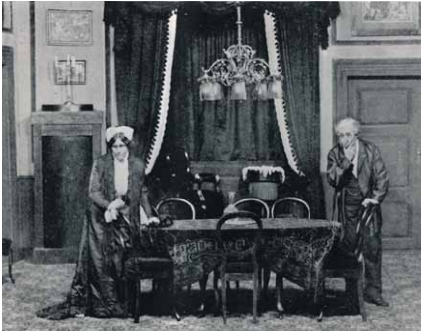
Premiere på Indenfor Murene fra 1912 med Karl Mantzius og Sigrid Neiiendam i rollerne som ægteparret Levin.