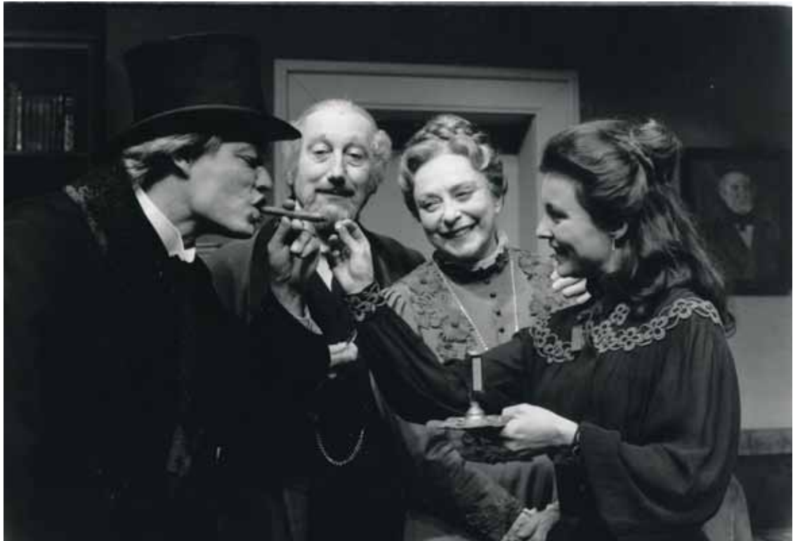
Indenfor Murene 1992 Folketeatret Helle Virkner og John Hahn-Petersen som ægteparret Levin