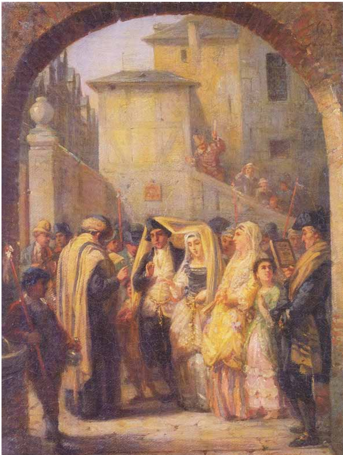
Moritz Daniel Oppenheim: Brylluppet, 1861.