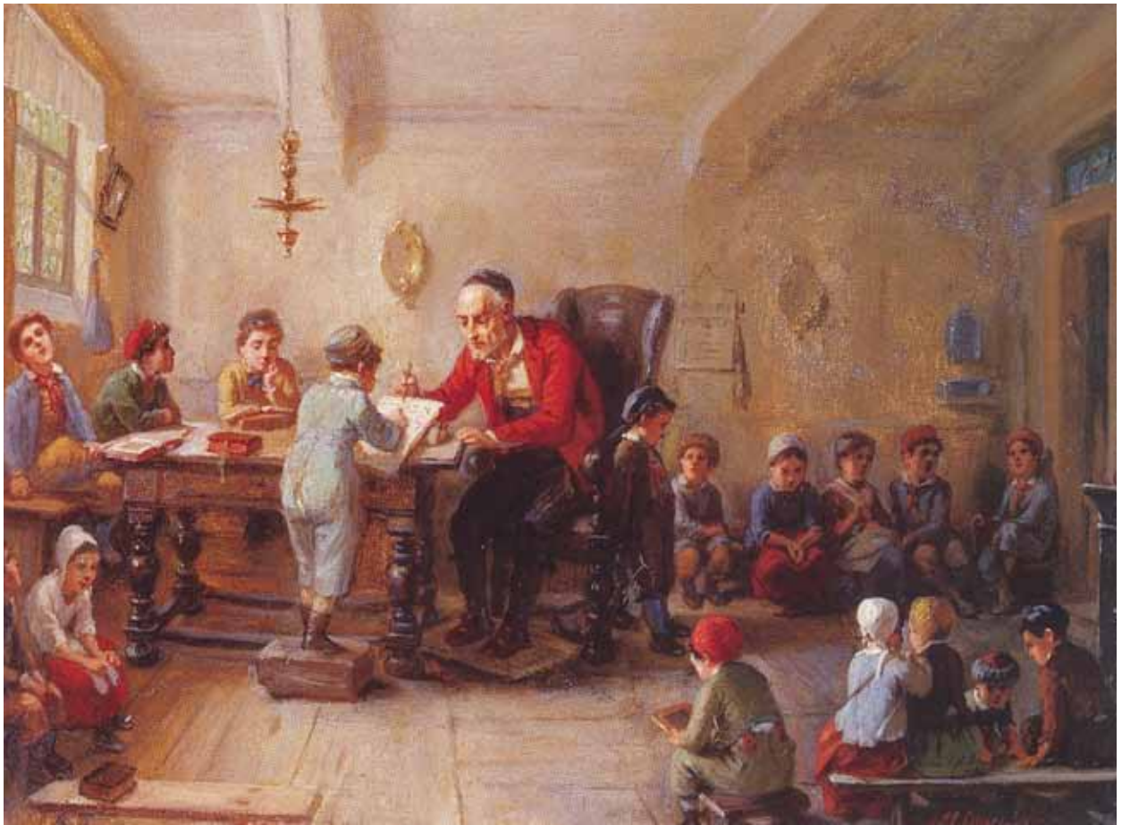
Moritz Daniel Oppenheim: Chederen – Den jødiske Grundskole, 1878.

frisindede. Goldschmidt ønskede således udvikling og emanciperings, men ikke på bekostning af sin religion.