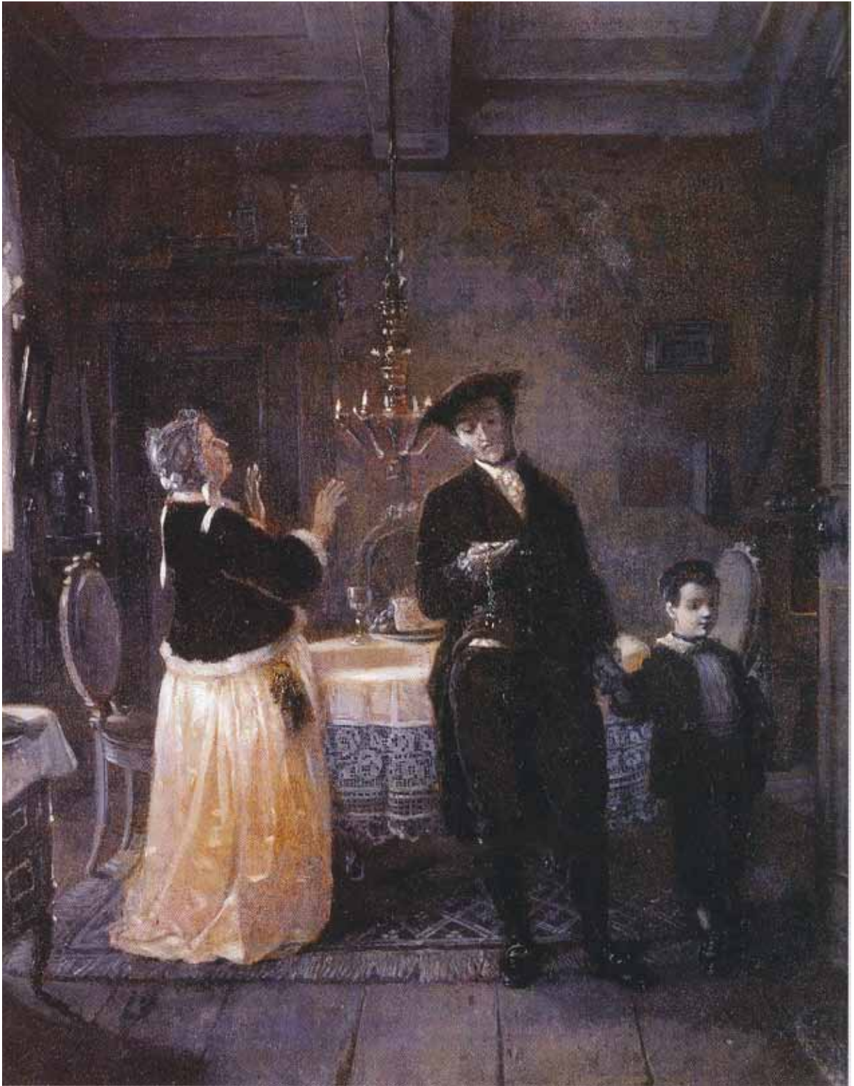
Moritz Daniel Oppenheim: Shabbaten begynder, 1865.