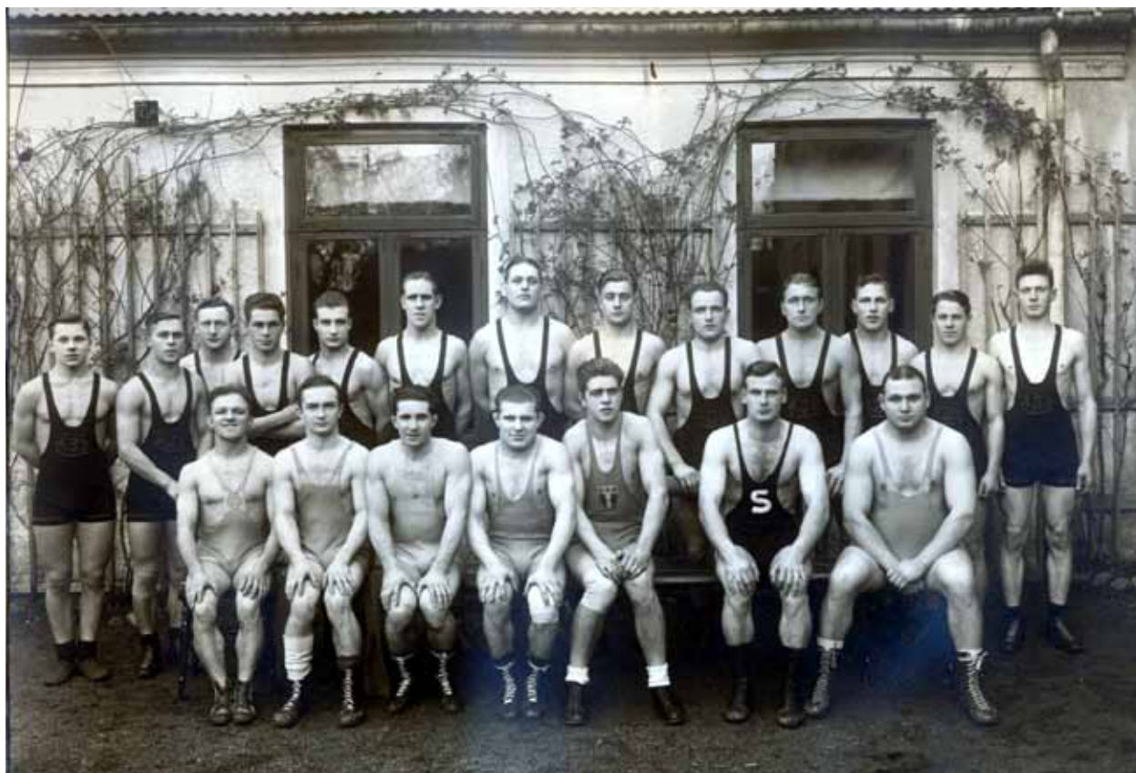
Hakoahs bryderhold under en turné i Sverige, 1936.