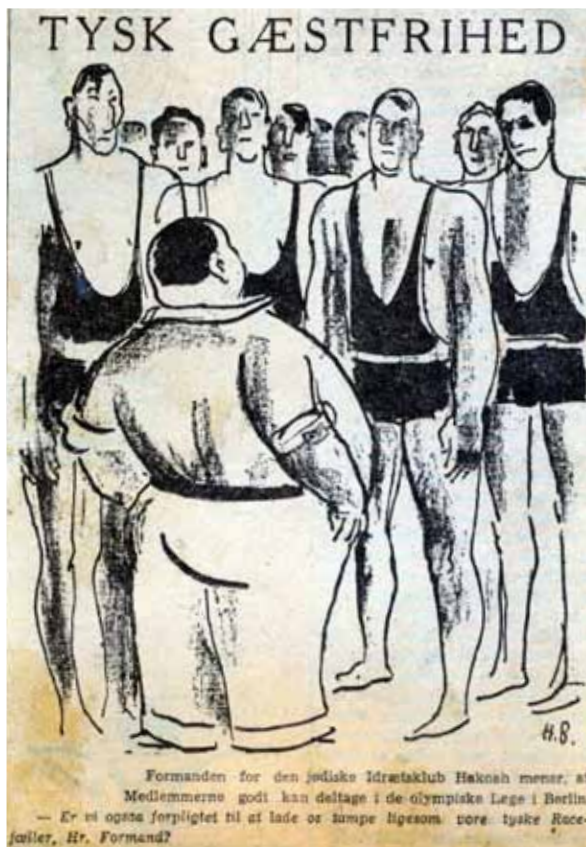
Satiretegning fra 1936 om deltagelsen i De Olympiske Lege 1936.

De angav, at der havde været flere indbydelser om kampe og rejser til Tyskland forud for denne episode, men dem havde de alle afslået. De oplyste dog ikke noget om, hvornår eller fra hvem disse indbydelser var kommet. Afslutningsvis udtalte de, at