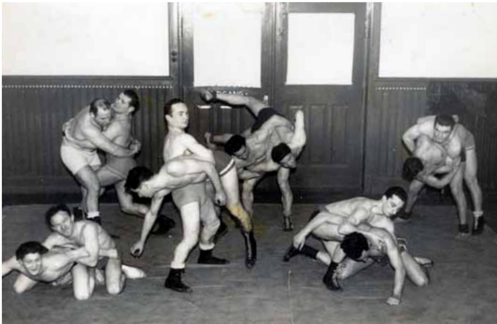
Træning i Idrætshuset i København i 1931. Hakoah var da en af landets stærkeste klubber, og træningsøvelser vakte opsigt og var et tilløbsstykke.

Idrætten i det nazistiske Tyskland blev, som så mange andre samfundsområder, præget af systematiske udelukkelse af jøder. 40.000 jøder havde før Hitlers magtovertagelse i 1933 dyrket deres idræt i 250 jødiske idrætsforeninger, og herudover dyrkede et ukendt antal tyske jøder deres idræt uden for de eksklusivt jødiske foreninger. Nu blev jøders idrætsudøvelse genstand for omfattende restriktioner, som førte til nedlæggelse af flere jødiske idrætsforeninger. Samtlige jødiske idrætsforeninger blev forbudt deltagelse ved alle former for stævner og kampe, hvor tyskere og udlændinge af arisk herkomst deltog, og senere udstedte den tyske regering også et udrejseforbud, der omfattede det samlede jødiske idrætsliv. 7