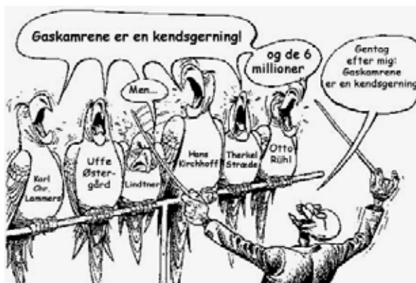
"Revisionisterne" hævder, at Holocaust-forskningen er underlagt censur. Tegner ukendt.

at anbringe dem i lejre og brænde deres lig, fordi de ellers smittede de tyske soldater. Når benægterne bliver konfronteret med kildemateriale og vidneudsagn, som vidner om massedrab, sult, kulde, tilfældig vold, brutalitet og skyderier, forklarer de rædslerne med, at al krig er brutal og umenneskelig. De mener, at nazisterne ikke var forskellige fra andre, der var i krig, og påpeger, at de allierede også begik krigsforbrydelser. Desuden opførte jøderne sig fjendtligt over for tyskerne, hjalp partisaner og skød på de tyske tropper, så det var nødvendigt at uskadeliggøre dem som enhver anden fjende.