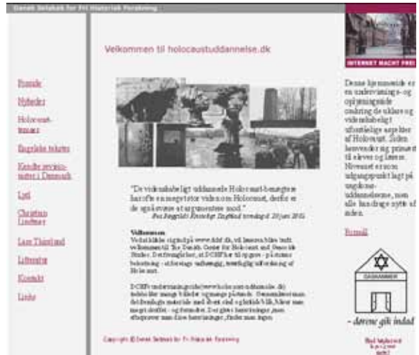
Dansk Selskab for fri Historisk Forskning lavede en hjemmeside der i sit grafiske udtryk lagde sig meget tæt op af DIIS'undervisningsportal, som ses til venstre. Indholdet var dog klart Holocaust-benægtende.

stand om Hitlers uskyld virke overbevisende. Et andet eksempel på benægternes tvivlsomme omgang med kildemateriale vedrører udformningen af gaskamrene i Auschwitz. Det er umuligt definitivt at bevise, om dørene til gaskamrene i Auschwitz åbnede indad eller udad. Det får benægterne til at afvise, at gaskamre i det hele taget eksisterede, ud fra en antagelse om, at det ville være for svært at åbne døren og fjerne ligene fra et gaskammer, hvis døren åbnede indad. Hvor en faghistoriker bygger sin viden om gaskamre på en lang række kilder – hundreder af vidner, dokumenter, fysiske levn og meget andet – så benytter benægterne helt usagligt manglende viden om én detalje omkring dørhængsler til at afvise eksistensen af gaskamre og omfanget af folkedrab.