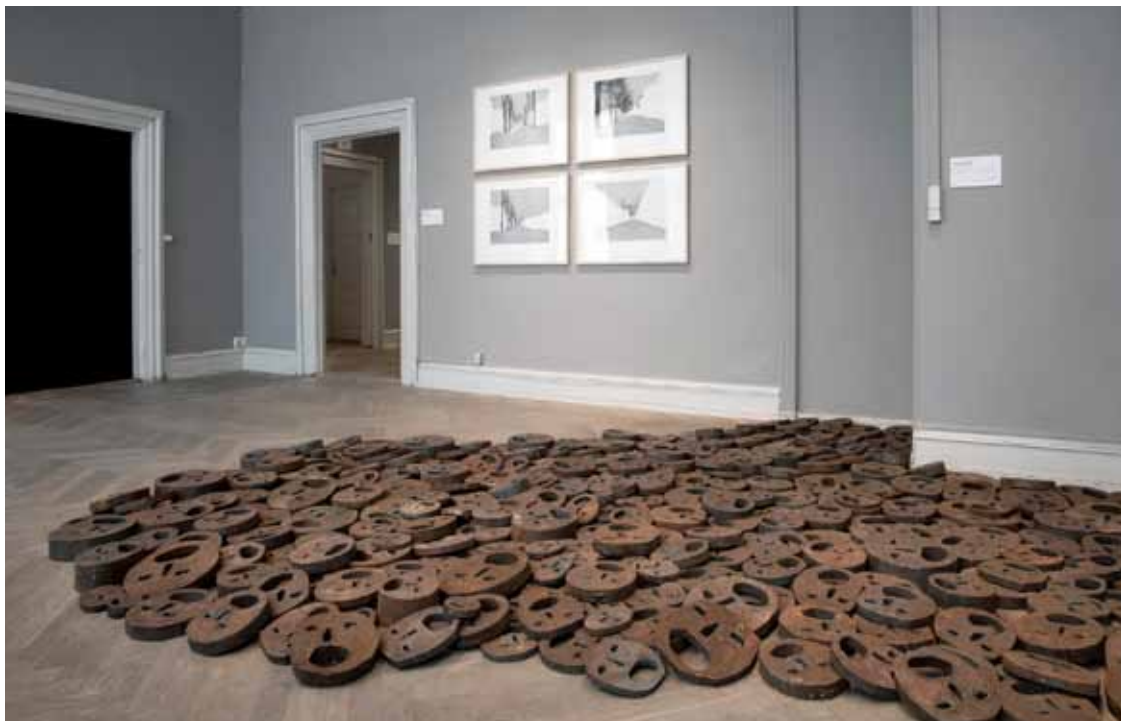
Israelske Menashe Kadishman: Faldne Blade, 1993.

På væggen: Polske Miroslaw Balka: A Crossroads in A., 2006.