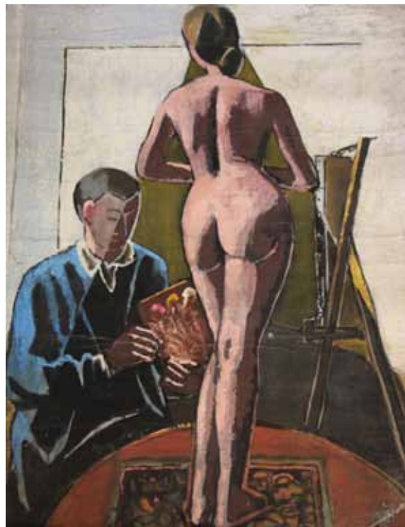
"Kvinde set bagfra". I atelieret i Paris ca. 1930.