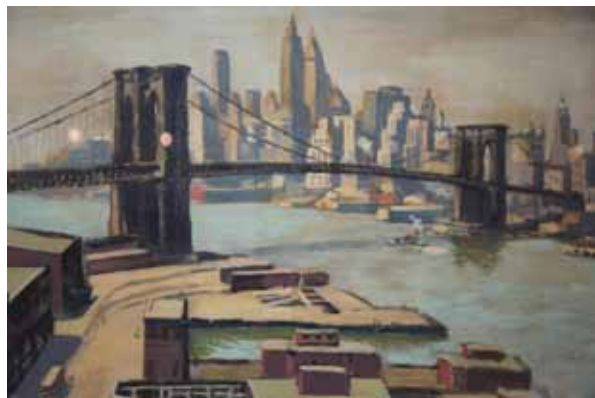
"Brooklyn Bridge", 1929.