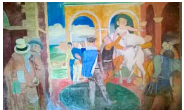
"Kvinderovet på Capri". Malet som al fresco-maleri på en af væggene i sommerhuset i Hundested ca. 1919.