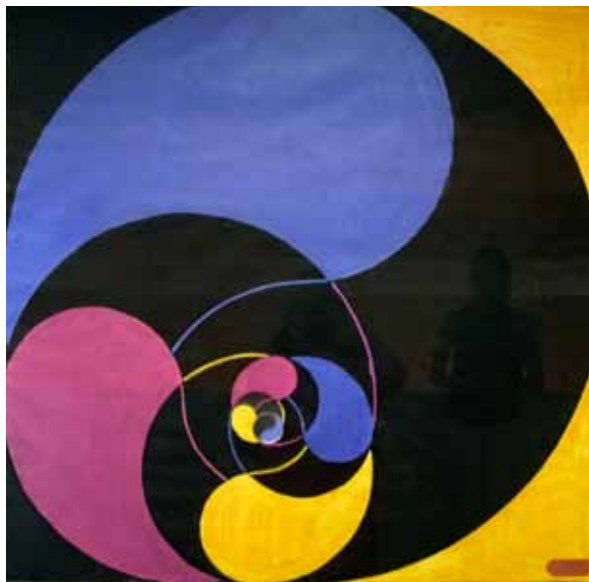
"Opus 672-C", malet i 1972. Udstillet på Appleton Museum of Art, Ocala, Florida, maj 2014.