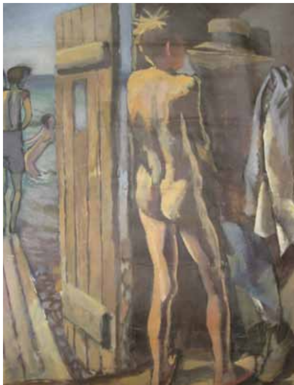
"Fra Lemches badehus". Hundested 1920-25.