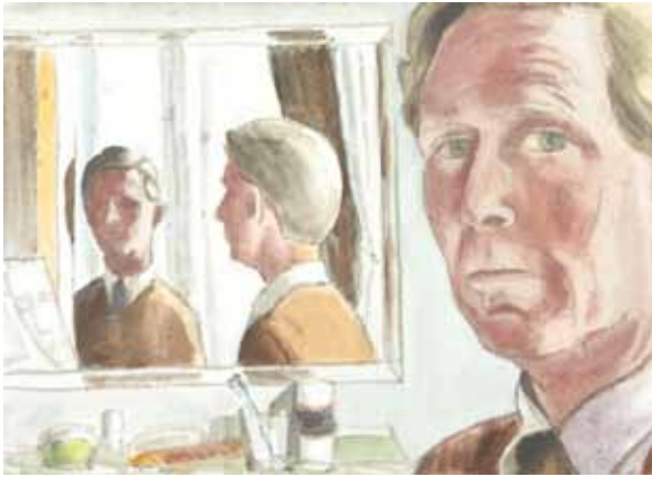
"Selvportræt i spejl". USA ca. 1940.