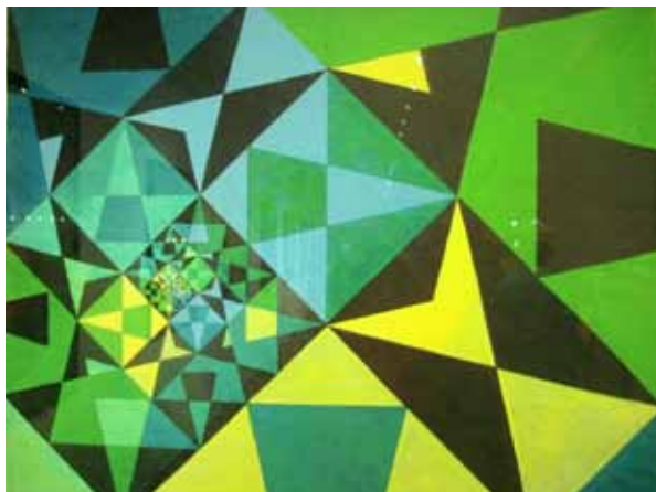
Usigneret og uden titel. 1970-75. Udstillet på Appleton Museum of Art, Ocala, Florida, maj 2014.