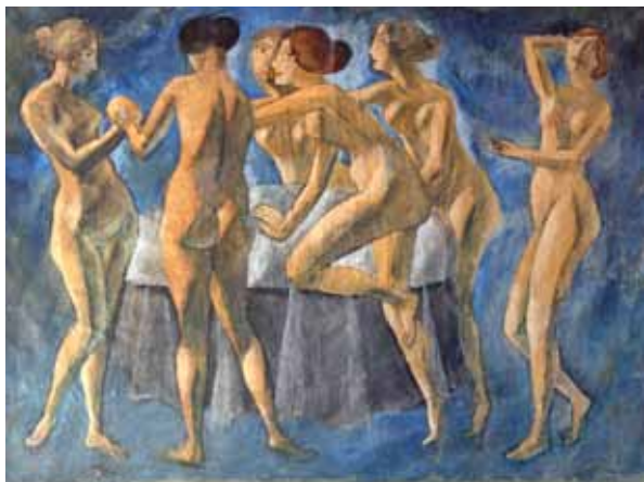
Billedet af de skønne damer med guldbløt hænger i sommerhuset i Hundested og er det første man ser, når man træder ind ad døren. 1918.