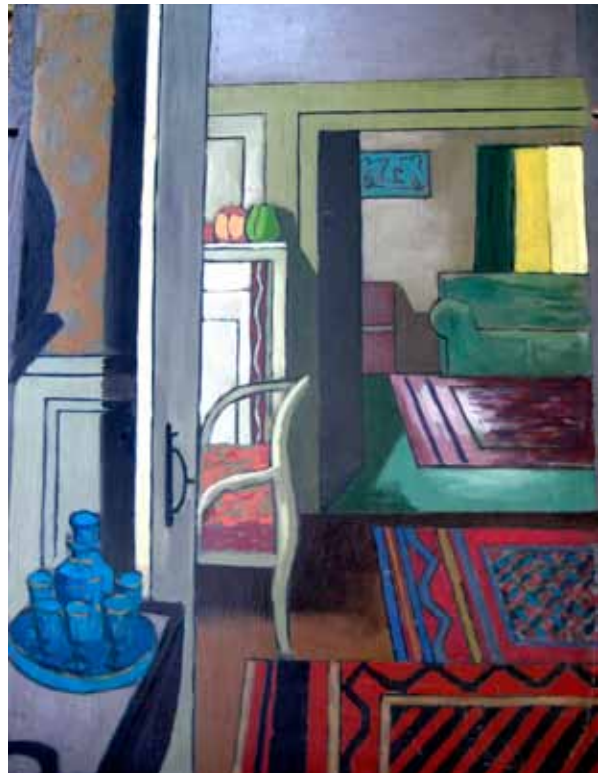
Interieur fra huset i Malvern. 1940'erne.