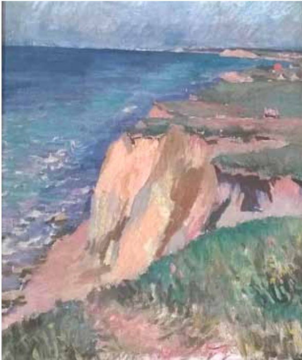
Kikhavn set fra Spodsbjerg. Malet i 1912.