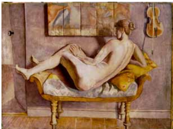
"Ung pige på lille sofa (løjbænk)", som var med på udstillingen i Stockholm i 1919.