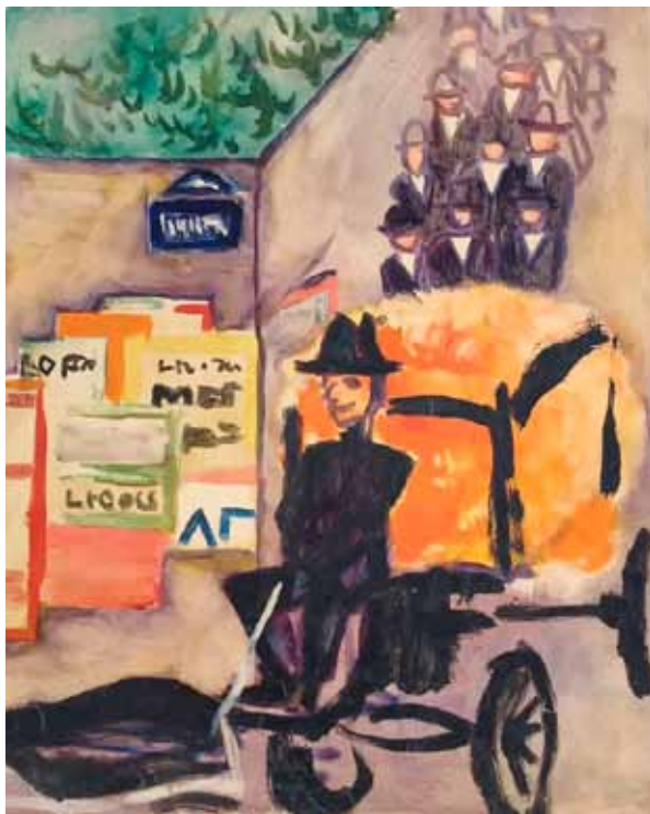
"Funeral Procession". Paris ca. 1925.