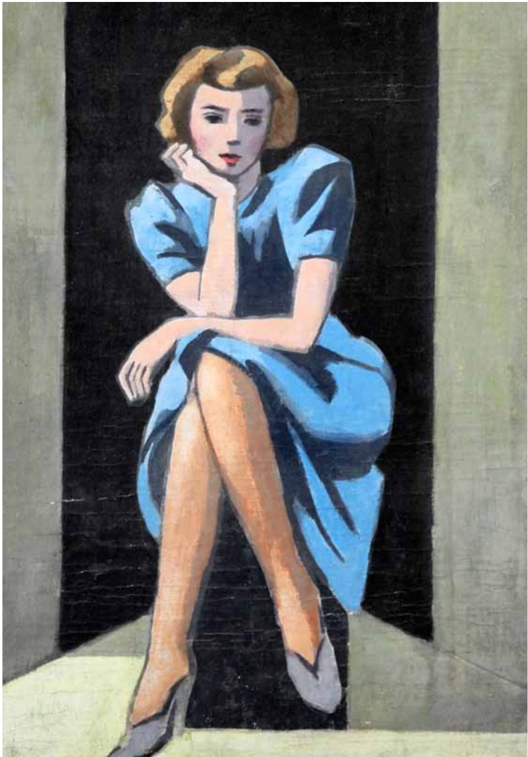
"Lady in blue". USA ca. 1955.