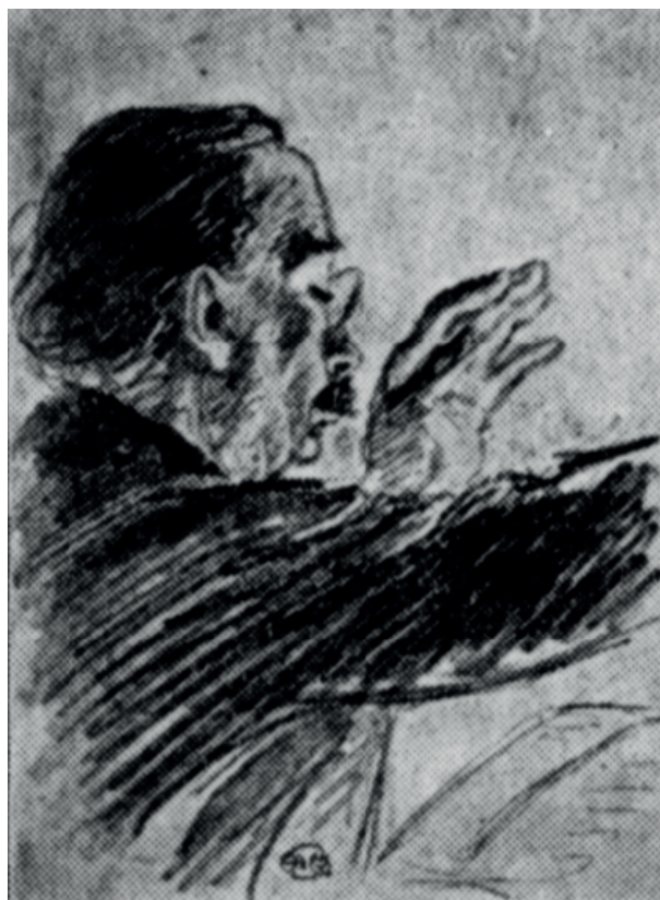
Tegningen af Bendix er fra en nekrolog i Nationaltidende i 1926. Bendix blev aldrig en del af den musikalske inderkreds i Danmark, og i sine sidste leveår blev han anset som en overgangsfigur.

Efter århundredskiftet begyndte udviklingen inden for musikken for alvor at gå hurtigt, og det gik langt videre, end Bendix ønskede. Nok var han fremskridtsorienteret, men ikke på bekostning af de lærde, akademiske værdier, som han selv mestrede så suverænt, og som han frygtede var ved at blive tabt i udviklingen. Stilistisk er der derfor ikke den store forskel på den musik, han skrev efter år 1900, og den, han havde skrevet to-tre årtier tidligere. Dertil kom, at han som komponist skruede ned for produktiviteten. Det gjaldt faktisk de fleste danske komponister fra den romantiske retning, for eksempel hans jævnaldrende og meget populære kollega P.E. Lange-Müller, der ligesom Bendix mente,