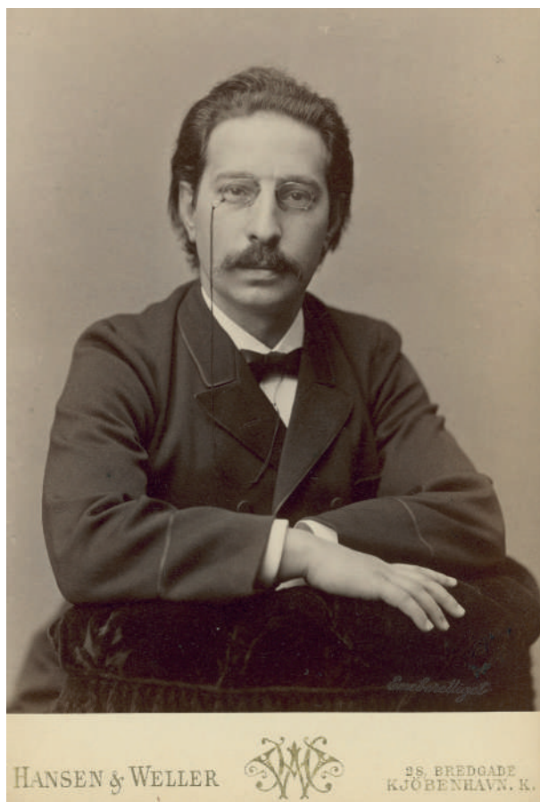
Fotografi af Victor Bendix, ca. 1885. Ved århundredskiftet var Bendix en af de vigtigste personer i dansk musikliv.

Men hvad var det helt præcis, der gjorde, at Bendix trods sine centrale roller og store anerkendelse blev en paria i dansk musikliv – en genialt begavet kunstner, der kørte sit eget løb ved siden af musiklivets institutioner? Det talte man ikke rigtig højt om, og kilderne er derfor meget spagfærdige. De største forhindringer for Bendix