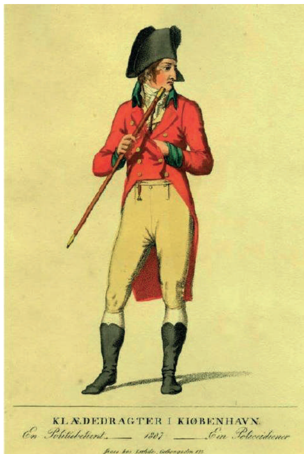
Denne meget synlige politiuniform prægede gadebilledet fra 1793 til 1850. Den folkelige betegnelse for disse betjente var blandt andet ”de røde engle”. Farvelagt tegning af Senn og Lahde, 1807.

Den sene enevælde var et før-sekulært luthersk samfund, hvor den evangelisk-lutherske statskirke var skrevet ind