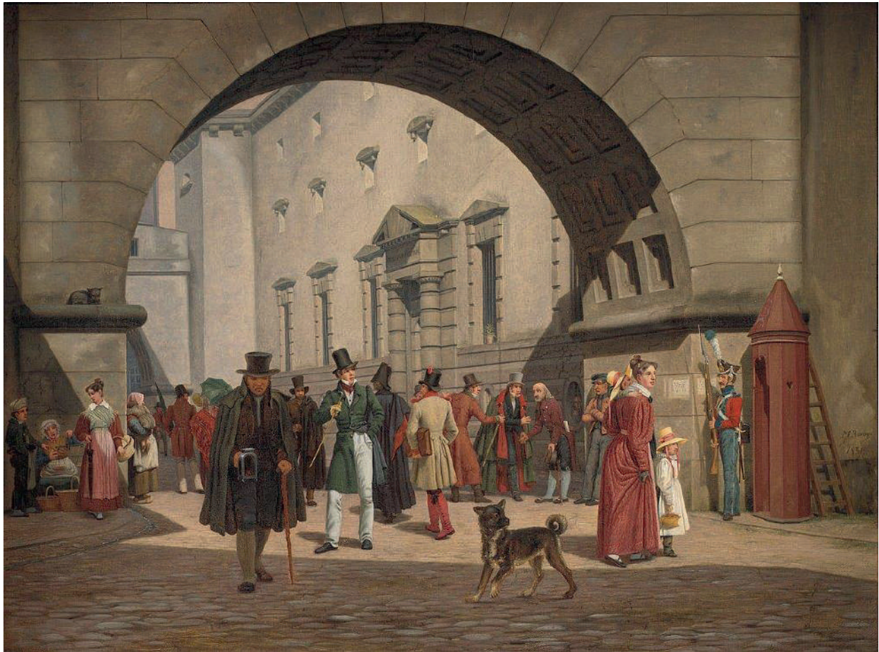
På råd- og domhuset ved Nytorv nær Østergade i København blev flere af arrestanterne ved jødeforfølgelserne dømt. Huset blev bygget af C.F. Hansen i 1815. Billedet viser folkelivet i Slutterigade mellem domhuset og det daværende fængsel. Til højre ses en tigger, som taler med to borgere, og bagved stikker en fange hovedet ud mellem fængselvinduets tremmer. Martinus Rørbye, 1831.

(...) en stor Folkestimmel fra Gothersgaden (...) der blev Indslaaet 5 a 6 vinduesruder i en Stue hos Collecteur Disler. 35