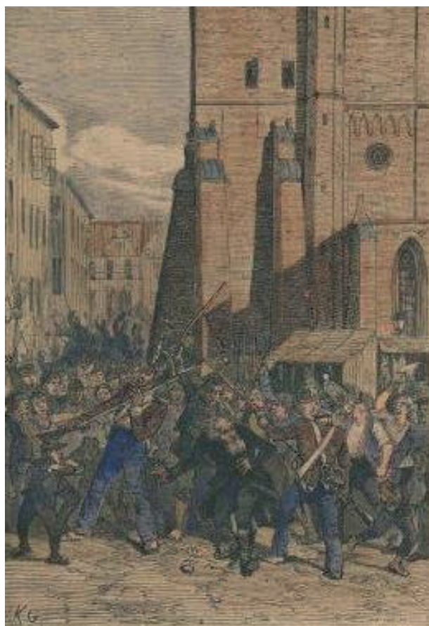
Folkemængden truer en gammel jøde. Han beskyttes af militæret fra hovedvagten. Tegningen er fra Nikolaj Plads i København i september 1819. Den udtrykker tegneren Knud Gamborgs noget folkelige gengivelse af de alvorlige forfølgelser. Han illustrerede Jacob Davidsens bog: Fra det gamle kongens Kjøbenhavn, 2. bind, København 1880-81.

af disse ordrer blev overladt til politidirektøren, som imidlertid aldrig fik opklaret, om jødeforfølgelserne var planlagt af nogle bestemte personer, og om der var tale om en egentlig organiseret "bevægelse". Håndhævelsen af udgangsforbuddet startede den 11. september. Der blev de følgende dage bragt arrestanter til de fem politiretter i hovedstaden. Københavns Politiret, 5. afdeling, dømte således ca. 70 borgere, som havde overtrådt udgangsforbuddet. 22