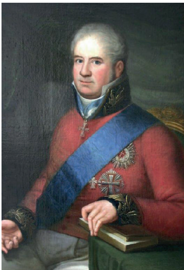
Gehejmestatsminister og politichef Frederik Julius Kaas (1758-1827) fik en hovedrolle under urolighederne i København i 1819-1820. Han var søn af en admiral og selv jurist med megen indflydelse hos Frederik 6. Maleriet er af en ukendt maler og ejes af Herlufsholms Kostskole.