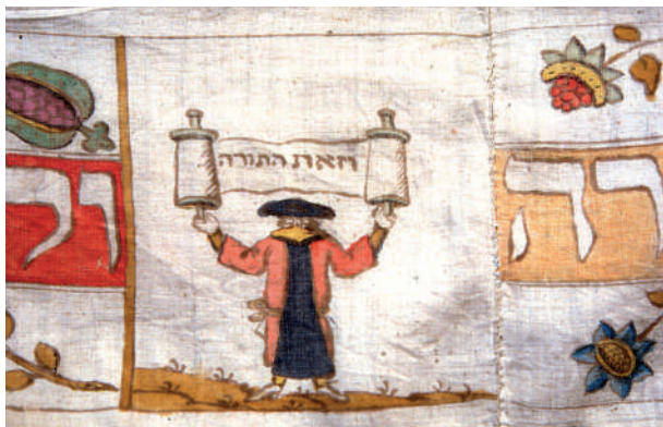
Torahvimpel fra begyndelsen af 1800-tallet.