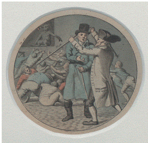
Uro i København. Sandsynligvis tegning af C.W. Eckersberg. Proveniensen ukendt.