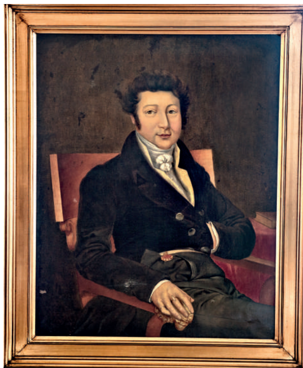
Portræt af M.L. Nathanson, ukendt maler. Portrættet hænger i dag på Berlingskes chefredaktørs kontor. M.L. Nathanson var i 60 år chefredaktør for Berlingske Tidende og omskabte avisen fra at være en gammeldags avis til at være en moderne forbrugerorienteret avis.