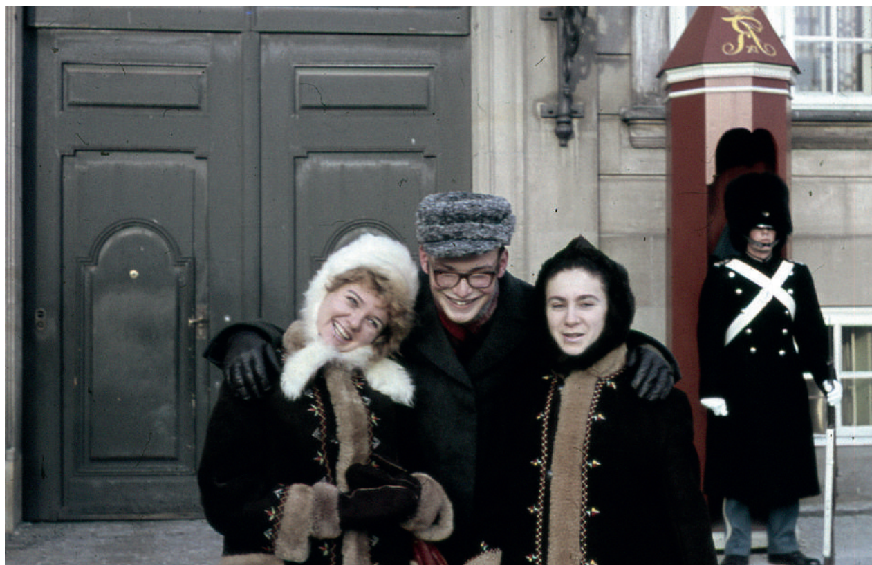
Giza, Giera og Pola på Amalienborg Slotsplads i slutningen af 1969.

Rambam viser på de næste sider et lille udsnit af Dansk Jødisk Museums store samling af fotografier relateret til polske jøders ankomst fra 1968 og fremefter. Samlingen indeholder både portrætfotos samt fotografier af steder og begivenheder, og de afspejler på forskellig vis polsk-jødiske flygtninges møde med Danmark.