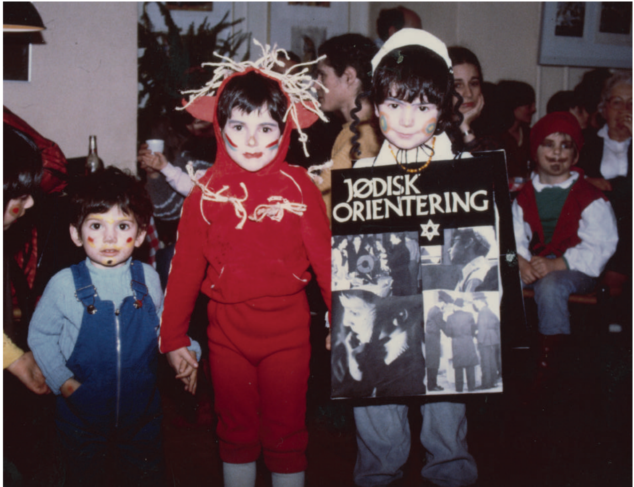
Børn klædt ud til Purim i 1985.