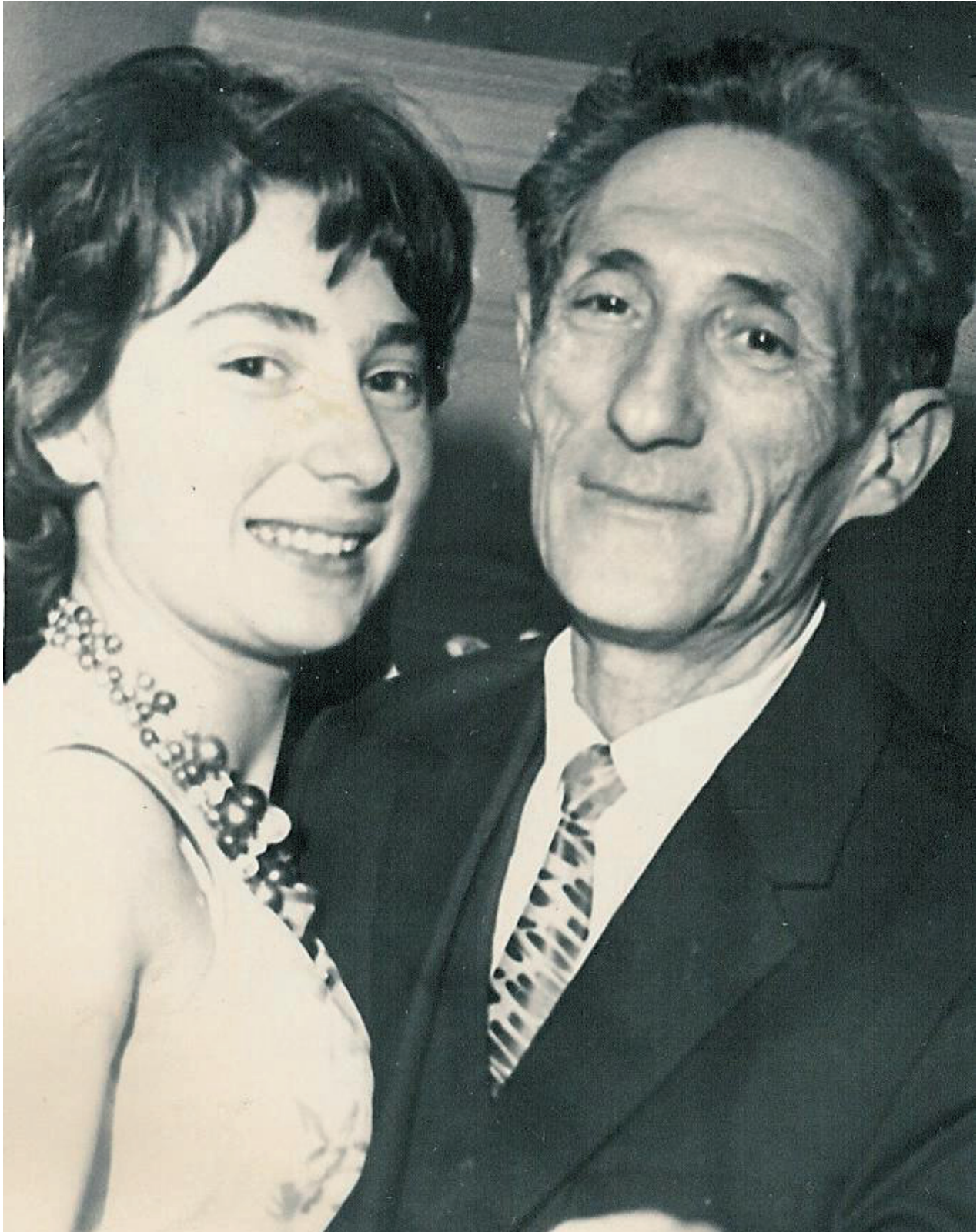
Malka til sin søsters bryllup sammen med sin far, februar 1965 i Polen.

Polske jøders møde med Danmark – i billeder