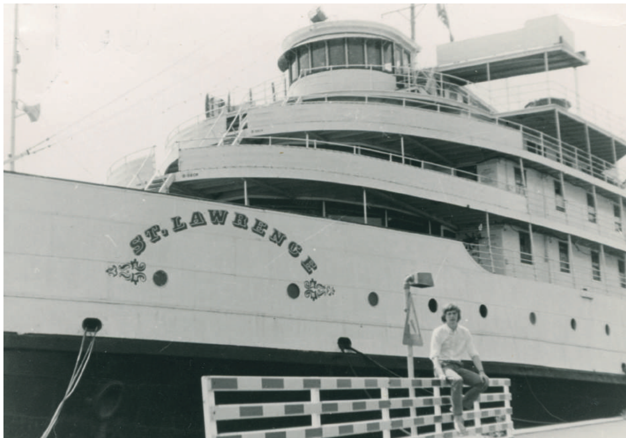
Hotelskibet St. Lawrence i sommeren 1970, hvor mange af de polske tilflyttere fik deres første hjem i Danmark.