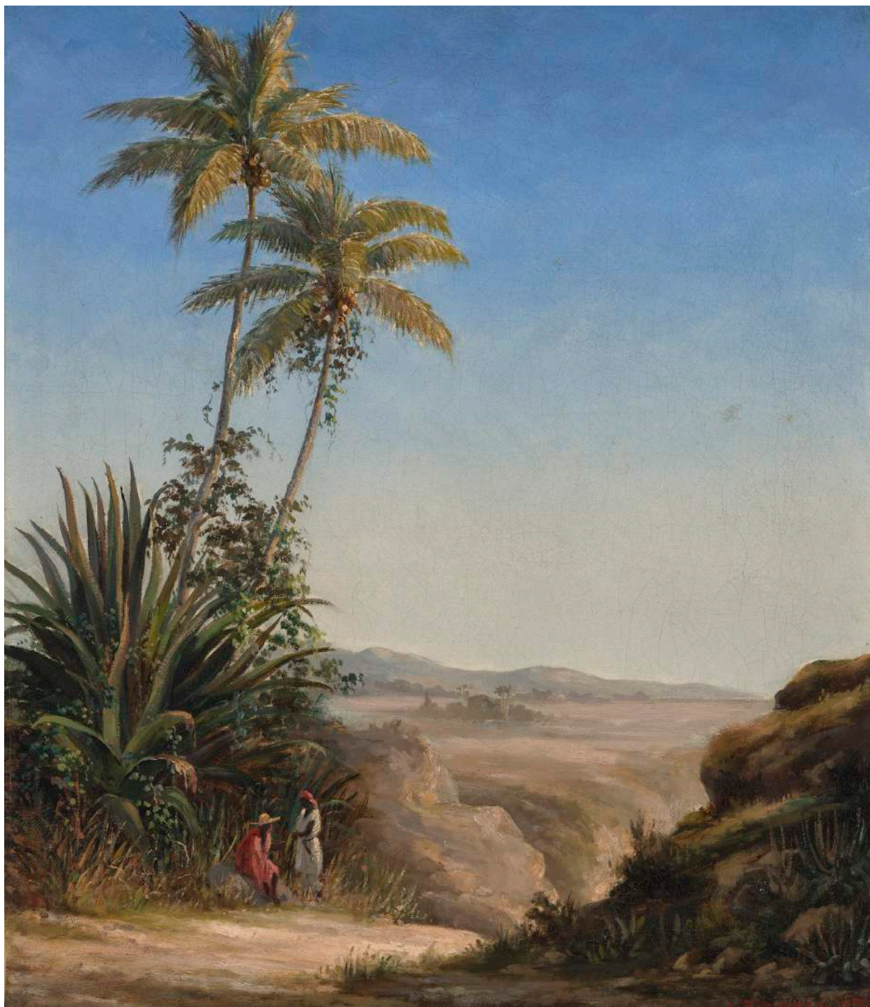
Ø.tv: Camille Pissarro, "Palmer", 1852.