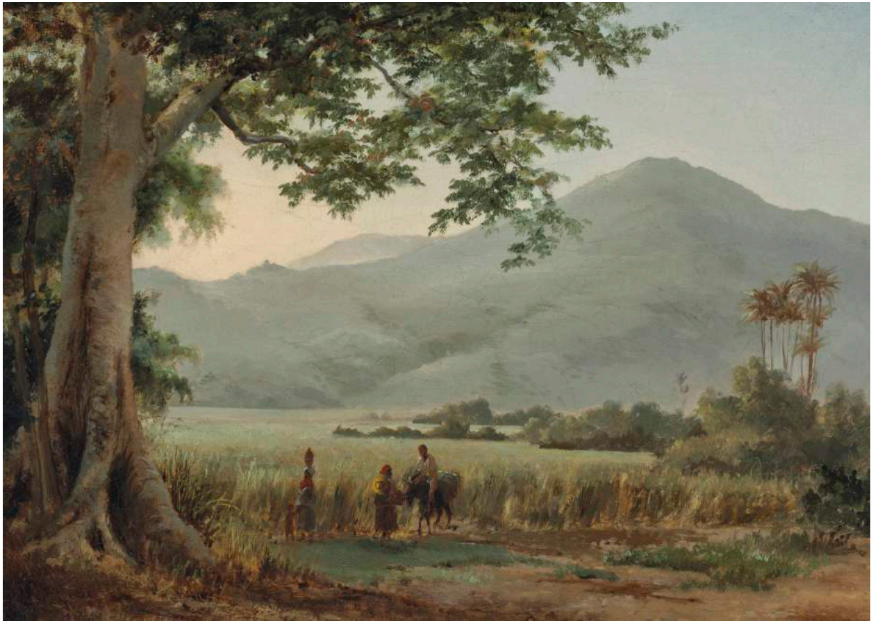
Camille Pissarro, "Personer diskuterer i vejkanten", 1856.

Rambam bringer på de følgende sider en række malerier af De Vestindiske Øer malet af den dansk-franske kunstner Camille Pissarro. Malerierne er fra udstillingen Pissarro. Et møde på Skt. Thomas , som blev vist på Ordrupgaard fra den 10. marts til den 2. juli i år i anledning af 100-året for Danmarks salg af De Vestindiske Øer.