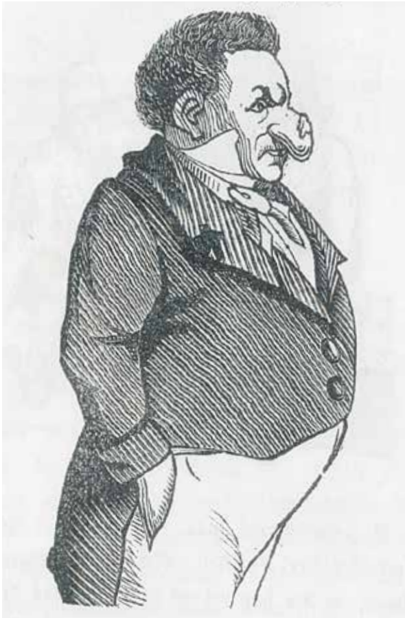
ved Rigsdagens Behandling af Aagerloven.