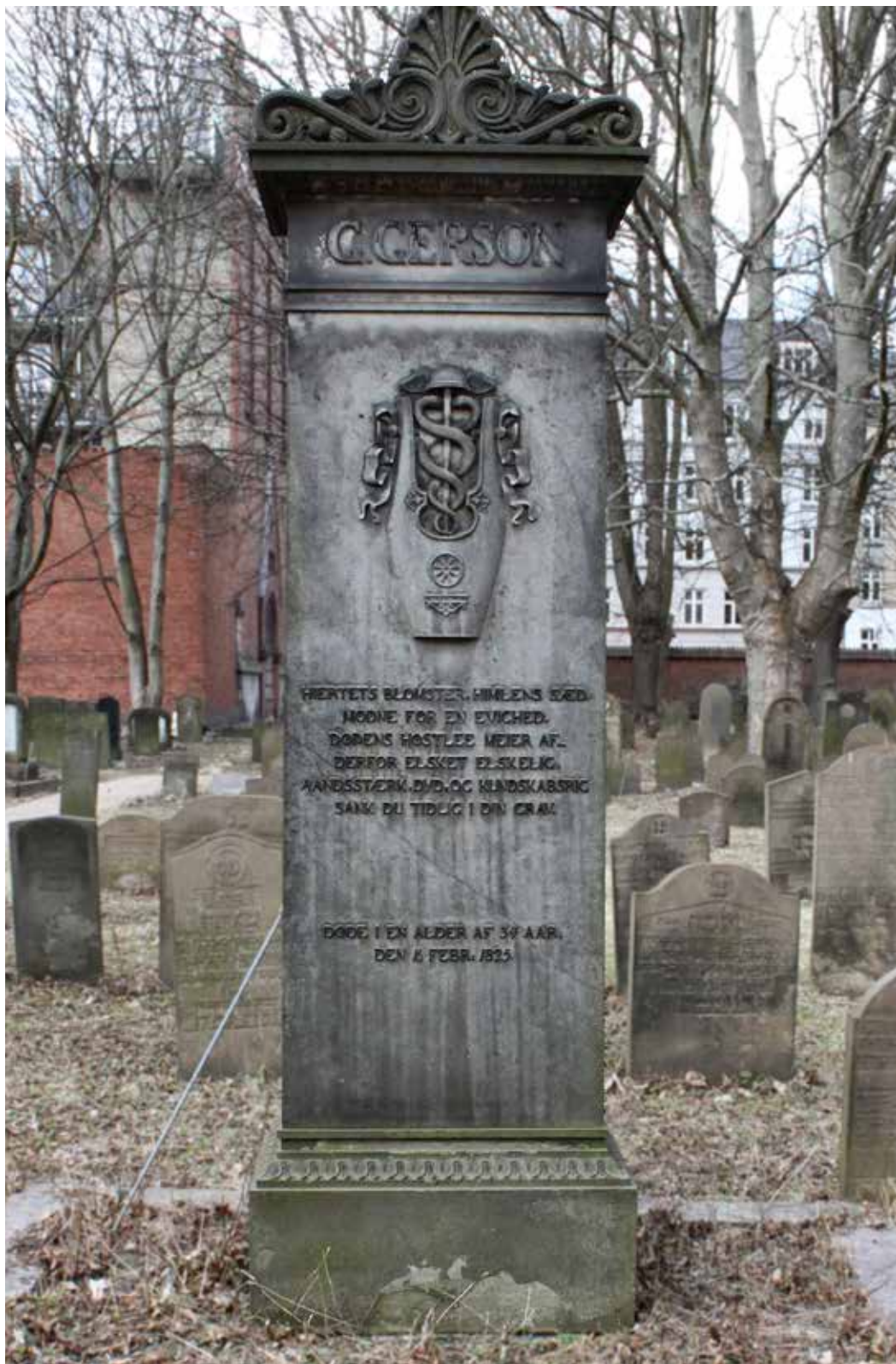
Georg Gersons gravsten, Mosaik Begravelsesplads i Møllegade.