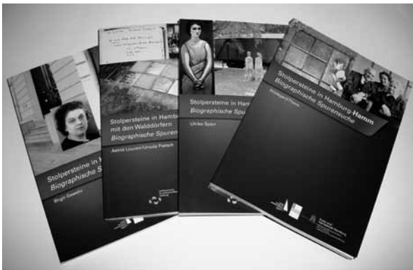
Fig. 1. De fire første bind i rækken Stolpersteine in Hamburg .

I forbindelse med placeringen af over 2700 snublesten (Stolpersteine, se også side 76-79 i dette nummer af RAMBAM) i Hamborg, har Institut für die Geschichte der Deutschen Juden udgivet fem flotte publikationer om de personer som man mindes på stenene i Hamborg. Lignende projekter har været igangsat i andre tyske byer, men publikationerne fra Hamborg Instituttet er afgjort de mest ambitiøse og fyldige. Man gennemgår en eller to bydele i Hamborg i hvert bind, og gennemgår alle snublestenene. Der er også en liste over alle de deporterede og myrdede fra bydelene, men vigtigst af alt er de grundige biografier om de mennesker som mindes på stenene i fortovene. Man har naturligvis ikke oplysninger om alle, men der gives eksempler på alle ofre, navnlig jøder, men også politiske ofre, religiøse ofre som Jehovas Vidner, modstandsfolk, bl.a. andet militærfolk som gjorde opstand.