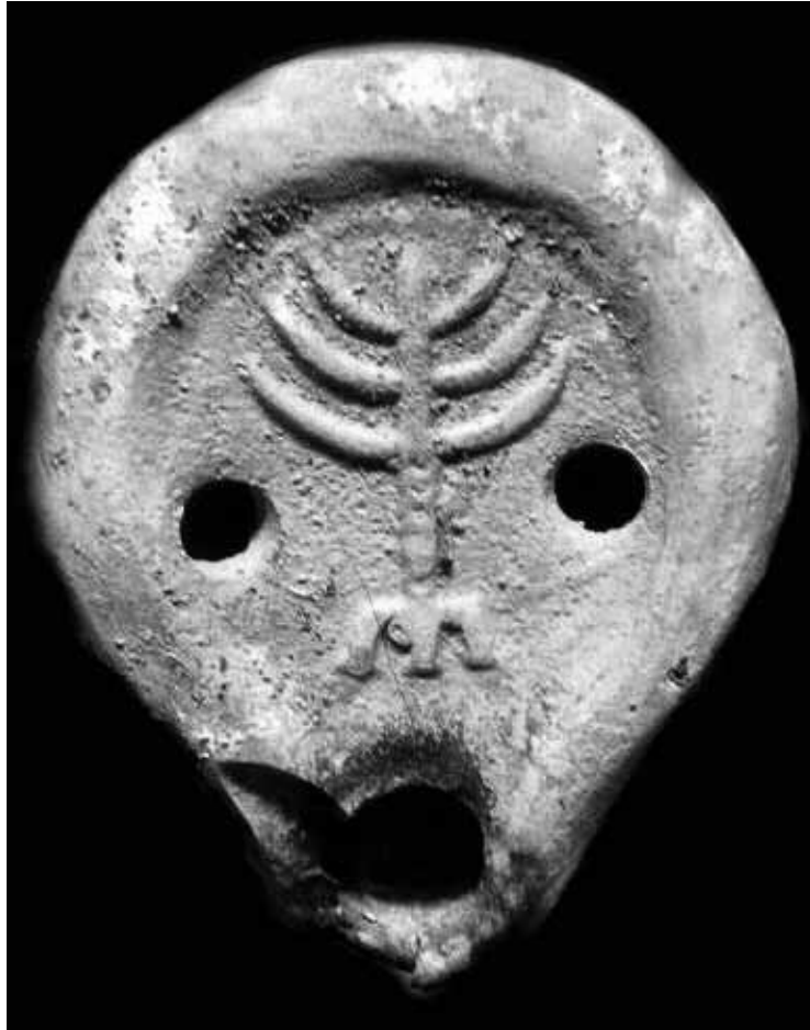
Fig. 4. Olielampe fra 300-årene, fundet i Köln.