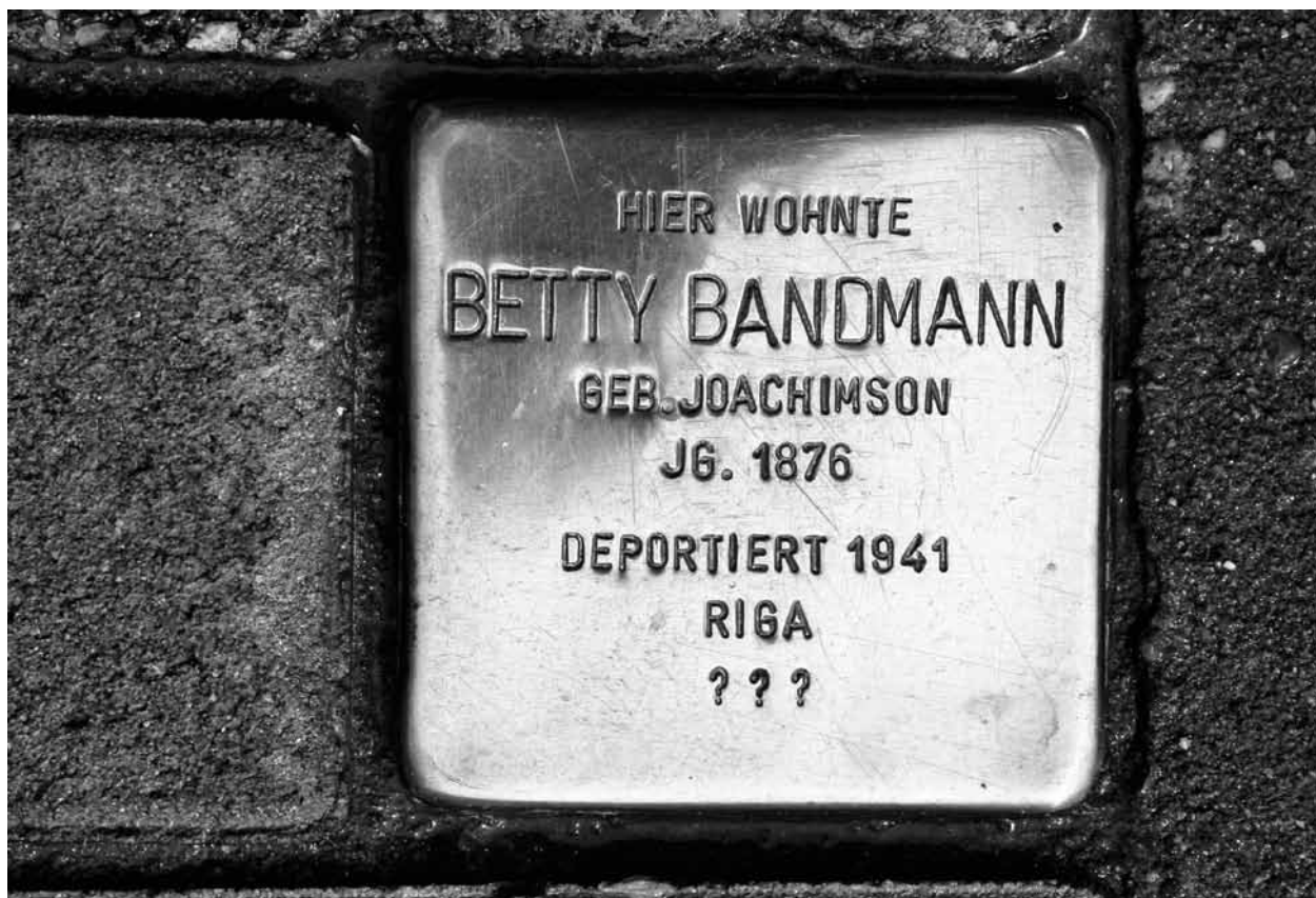
Stolperstein i Hamburg.