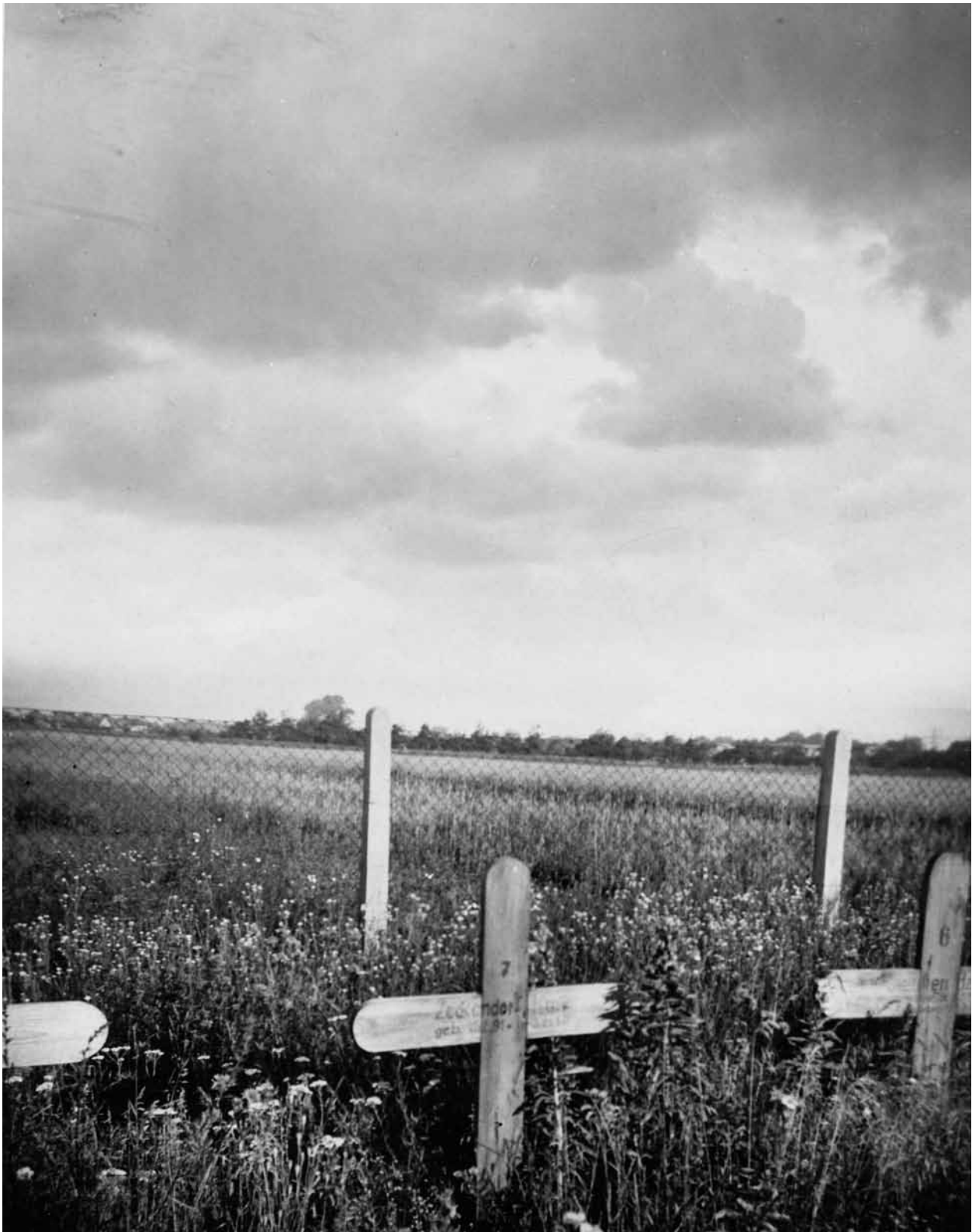
Fig. 3. Kurt Zeckendorfs grav i Oranienburg i september 1938.