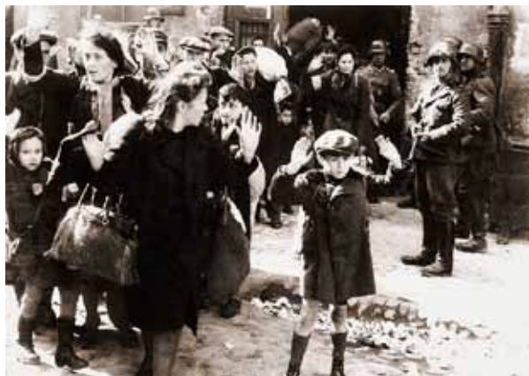
Illustration 3 er tegnet af Per Marquard Otzen og blev ifølge Jyllands-Posten den 16. januar 2009 8 oprindeligt trykt i Politiken den 14. januar 2009 i forbindelse med Gaza-konflikten. Til højre et fotografi af anonym fotograf fra 1943, hvor jødiske kvinder og børn i ghettoen i Warszawa eskorteres af nazistiske soldater til en udryddelseslejr. 9

Det antisemitiske ved tegningen er at antyde, at det nuværende Israels politik over for palæstinenserne kan sammenlignes med nazisternes forfølgelser af jøderne under Anden Verdenskrig, men nu med