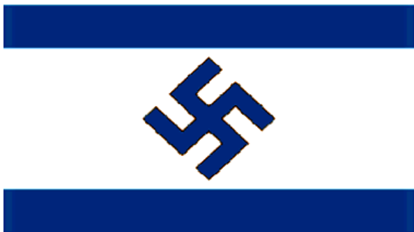
Illustration 4 er ifølge Jyllands-Posten fra den 16. januar 2009 10 og er blandt andet blevet vist på dansk-tyrsk Gülay Kocbays blog i forbindelse med Gaza-konflikten i januar 2009.

Det er også udtryk for antisemitisme og ikke bare ekstrem antizionisme at erstatte davidsstjernen i det israelske flag med et hagekors, som det er gjort i illustration 4. Hagekorset står som det ultimative symbol for systematisk udryddelse af folkegrupper, hvor udryddelsen alene er begrundet i disse gruppers herkomst. Netop fordi Israel er en jødisk stat oprettet af FN som et tilflugtssted for Europas overlevende jøder efter nazisternes forfølgelser, kan sammenkædningen af Israel med nazistisk ideologi kun opfattes som en grov beskyldning rettet mod alle jøder og ikke bare mod den israelske stat eller regering.