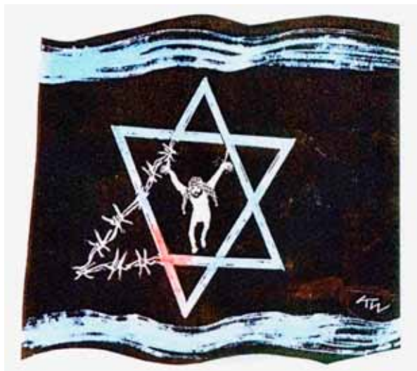
Illustration 2 forestiller en komisk udseende, lille jødisk mand, der desperat forsøger at få en davidsstjerne i opløsning til at hænge sammen, mens den gradvist ændrer form til et hagekors.

Illustration 1. Er tegnet af Kurt Westergaard og ifølge hjemmesiden http://www.israel-online.dk/media-watch/medier_danske_cartoons.php blev tegningen første gang trykt i Jyllands-Posten den 8. december 2008. Tegningen med den "korsfæstede" palæstinenser i centrum spiller på klassisk kristen antisemitisme. En palæstinenser, der er ophængt på denne måde, henviser ikke til nogen aktuel begivenhed i Palæstina-konflikten, men udtrykker den gamle kristne fordom om, at jøderne var skyld i henrettelsen af Jesus. Helt tilbage i middelalderen har denne fordom været udnyttet som en gennemgående legitimering af antisemitisme og jødeforfølgelser i Europa. 5