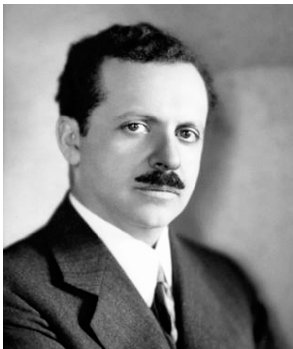
Fig. 6. Edward L. Bernays (1890-1995).

Ingen af de jødiske flygtninge, der blev holdt i Horserødlejren i 1940-1941 blev udvist til Tyskland i august 1941 sammen med tyske socialister. 27 Dette skyldtes ikke foranstaltninger truffet af danske embedsmænd og jødiske organisationer, sådan som det er blevet hævdet. Uden at modtage noget krav eller anmodninger fra tyskerne til udvisningen af fangerne i Horserød, havde det danske justitsministerium allerede i slutningen af juli 1941 udarbejdet og underskrevet udvisningsordrer for de fleste af de jødiske fanger i Horserød 1940-41. 28 Med undtagelse af én, der var flygtet i en robåd til Sverige og en anden, der begik selvmord på grund af hans frygt