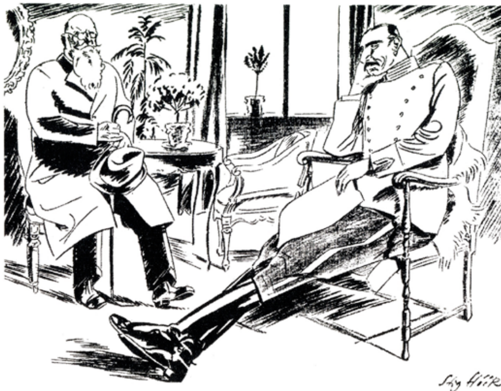
Fig. 2. En karikatur, som blev bragt i Göteborgs Handels- och Sjöfartstidning 10. januar 1942. Den forestiller Thorvald Stauning og Christian X, der foreslår at danskerne skal gå med gule stjerner. Den 10. september 1941 foreslog kongen efter sigende brugen af Davidsstjernen for alle i Danmark som reaktion på eventuelle krav fra den tyske besættelsesmagt om aktioner over for de danske jøder. Det gjorde han i samtale med Vilhelm Buhl, ni dage før en lov om de gule stjerner trådte i kraft i Tyskland og flere af de besatte lande – dog ikke i Danmark. Rigsarkivet ville i 2010 ikke fremme en ansøgning til kongehusets kabinetssekretariat, om tilladelse til at bringe et billede af kongens dagbogsindførelse med den meget tidlige omtale af jødestjernen som kongen kom med i 1941.