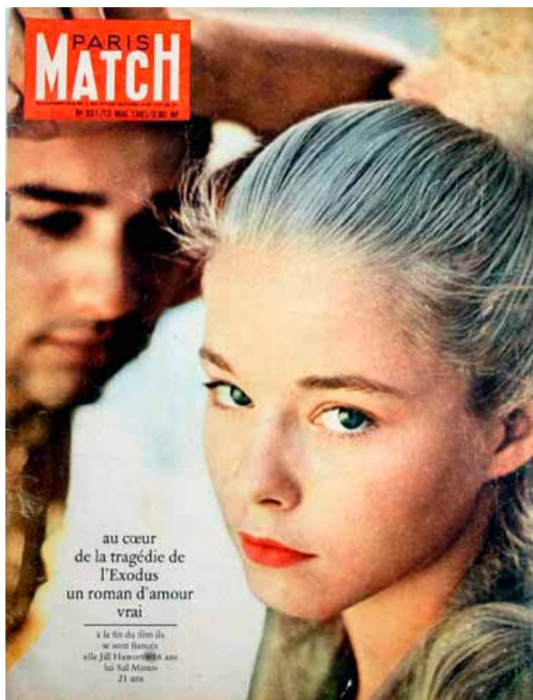
Fig. 1. Salvatore Mineo og Jill Haworth som henholdsvis Dov Landau og den lille jødiske Karen Hansen fra Danmark i Otto Premingers filmatisering af Exodus fra 1960. Karen Hansen var gråbåret i filmen til trods for skuespillerindens kun 15 år. I filmen finder hun til sidst sin far, som har mistet hukommelsen, og de slår sig ned i en kibbutz, hvor hun senere bliver myrdet af araberne. Billedet stammer fra pariserbladet Match fra december 1960.

Fra den tyske besættelsesmagts hovedkvarter på Hotel D'Angleterre kom der et påbud: ALLE JØDER SKAL BÆRE ET GULT ARMBIND MED DAVIDSSTJERNEN. Den følgende nat udsendte modstandsbevægelsen et budskab til alle danskere. På Amalienborg Slot har kong Christian givet det følgende svar til den tyske kommando om at jøderne skal bære Davidsstjernen. Kongen har sagt at alle danske er lige. Selv vil han bære den første Davidsstjerne og han forventer, at alle loyale danskere gør det samme. Den næste dag i København, bar næsten