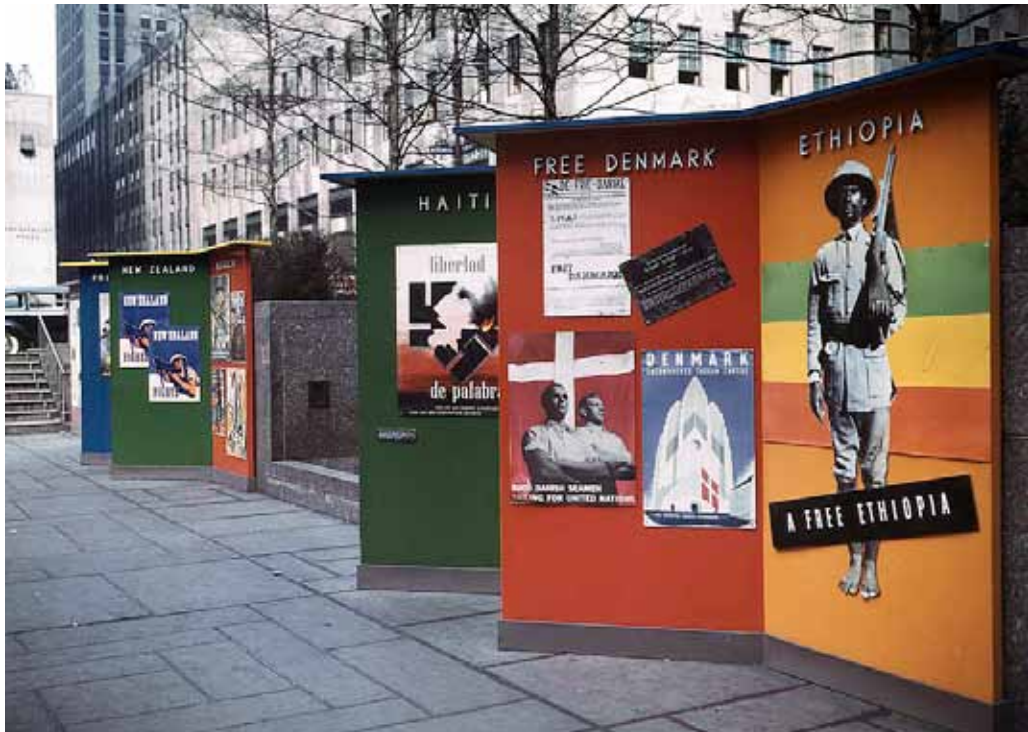
Fig. 10. Frit Danmark på plakaten på Office of War Informations udstilling på Rockefeller Plaza i New York i marts 1943. Fra højtalere ved torvet lød Roosevelt, Churchill og Chiang Kai-Sheks opfordringer hver halve time.

De blev holdt skjult, indtil undergrundsbevægelsen rapporterede om fri bane. Så blev de bragt til Sverige af fiskerne skjult i bådenes lastrum. Der var så mange både på søen, at tyskerne umuligt kunne afgøre, hvilke faktisk var i gang med fiskeri, og hvilke transportererede flygtninge. 35