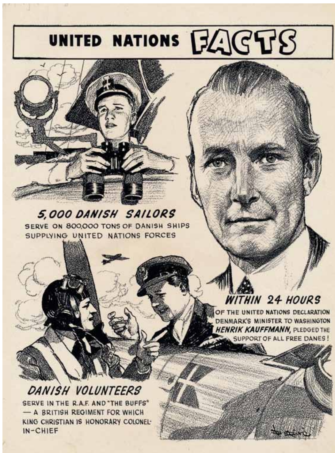
Fig. 8 . United Nations FACTS fra 1943. Propagandaplakat udarbejdet af Friends of Danish Freedom and Democracy i samarbejde med United Nations Information Organization, (tidl. Inter Allied Information Center eller UNIO), som danske interesseorganisationer i USA havde været medlemmer af fra 1941. Portrættet viser ambassadør Henrik Kauffmann. Niels Gyrestings samling.