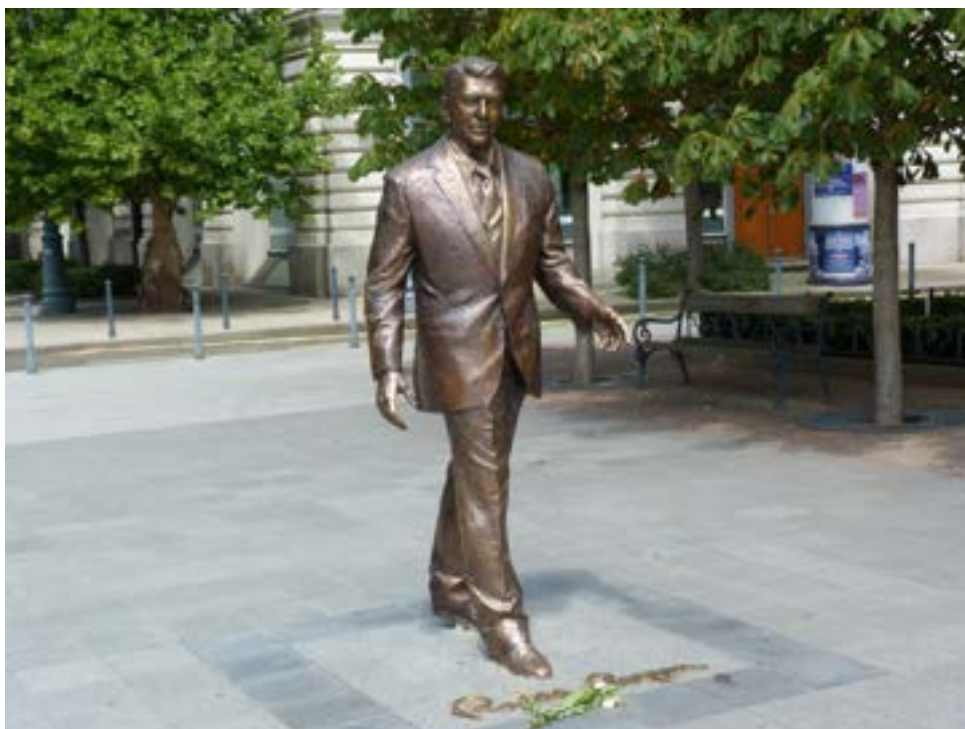
Statue af den tidligere amerikanske præsident Ronald Reagan i Budapest, Ungarns hovedstad.