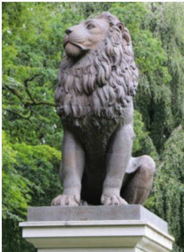
Istedløven tilbage på sin plads på Flensborg gamle kirkegård.

Umiddelbart efter Besættelsen kunne man vise sit danske sindelag ved at tage afstand fra Tyskland og det tyske. Nogle modstandsfolk havde åbenbart en del plastisk sprængstof i overskud. I løbet af sommeren sprængte de monumenterne ved Dybbøl og Arnkil og til sidst Bismarck-tårnet i luften. Også uden tårn vedblev Knivsbjerg at være det tyske mindretals samlingssted. I 1962, da der var gået et passende antal år efter besættelsen, accepterede de danske myndigheder, at der blev etableret en mindelund for de tysksindede nordslesvigere, der i tysk tjeneste var faldet under 1. og 2. Verdenskrig.