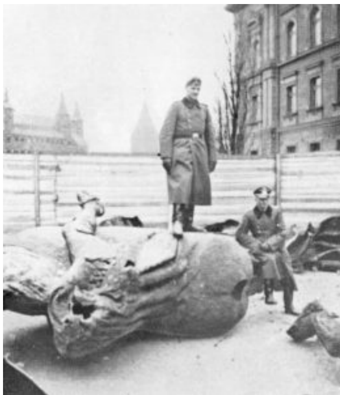
Tyske soldater ødelægger Grunwald-monumentet i november 1939.

I 1939 angreb Tyskland Polen og erobrede den vestlige del af land. Den nordlige del af det erobrede område blev indlemmet i riget, og den sydlige blev generalguvernementet Polen, der blev styret med ekstrem brutalitet af generalguvernør Hans Frank fra det gamle kongeslot i Krakow. Grunwald-monumentet var en torn i øjet på nazisterne. De kunne ikke leve med et monument over et slag, hvor et efter nazisternes opfattelse mindreværdige folk havde besejret tyske riddere. Derfor blev Grunwald-monumentet ødelagt. I 1976 blev monumentet rekonstrueret.