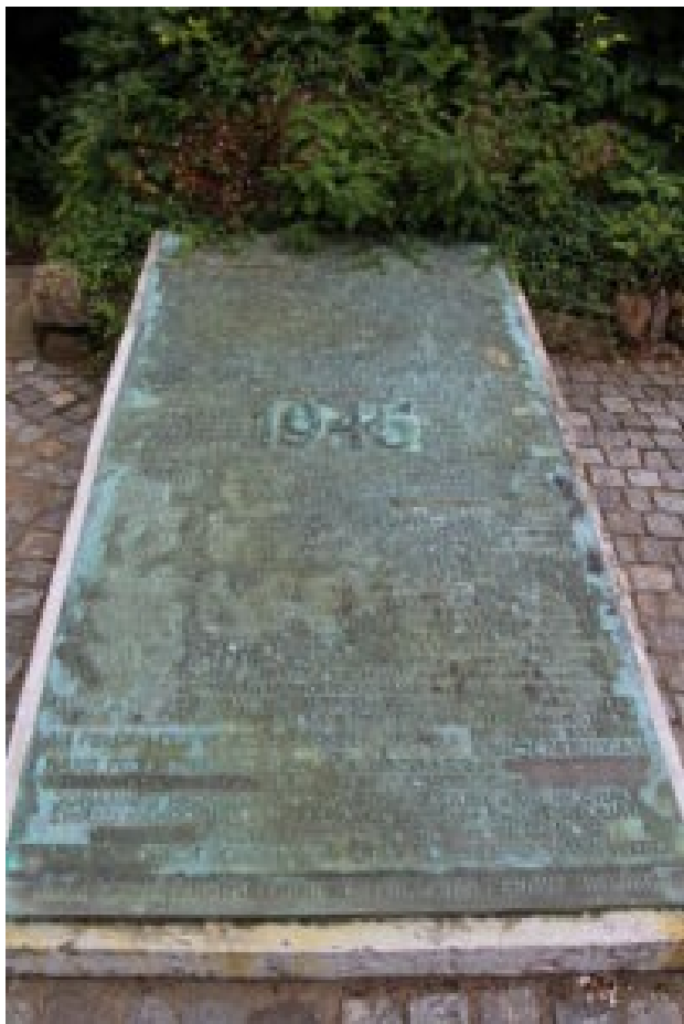
Mindesmærke over soldater fra det tyske mindretal i Nordslesvig, der faldt i tysk krigstjeneste. Nogle navne er fjernet. Det er navne på soldater, der deltog i krigsforbrydelser.

og den voksende bekymring for et tysk krav om revision af grænsen betød, at man fra dansk side gjorde alt for ikke at udfordre den mægtige nabo mod syd. Det indebar også, at diskussionen om sejrsmonumenterne forstummede.