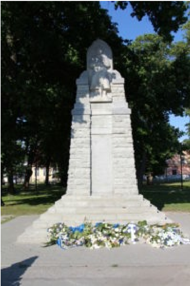
Frihedsmonument i den estiske by Haapsalu blev rejst i 1924. I 1941 blev det sprængt i 1941 af soldater fra Den Røde Hær. Som mange andre nationale monumenter blev det genopført, da Estland igen blev uafhængigt. Blomsterne viser, at monumentet stadig hører til den lokale erindringskultur.

Hovedparten af Kaunas mere end 30.000 jøder blev anbragt i lejren, hvor de blev mishandlet og dræbt og de overlevende transporteret til udryddelseslejre i Østeuropa. Monumentets budskab er klart: Kun nazister/fascister stod bag undertrykkelse, mishandlinger og massedrab. På den måde er monumentet et element af den sovjetkontrollerede østbloks erindringspolitik og grundfortællingen om socialismen/kommunismen som nazismens absolutte og frelsende modpol. Hvad monumentet ikke fortæller er, at det 9. fort i 1940-41 og igen fra 1945 til 1958 var et af NKVD's, det hemmelige sovjetiske politis, mange fængsler for politiske fanger. Her blev flere hundrede henrettet, hvis de ikke blev sendt til Sibiriens Gulag-lejre. Og det hører heller ikke til monumentets fortælling, at andre end tyskere var særdeles aktive i forfølgelsen af jøderne.