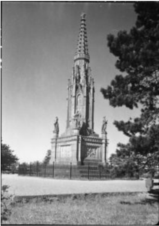
Tysk sejrsmonument på Dybbøl Banke.