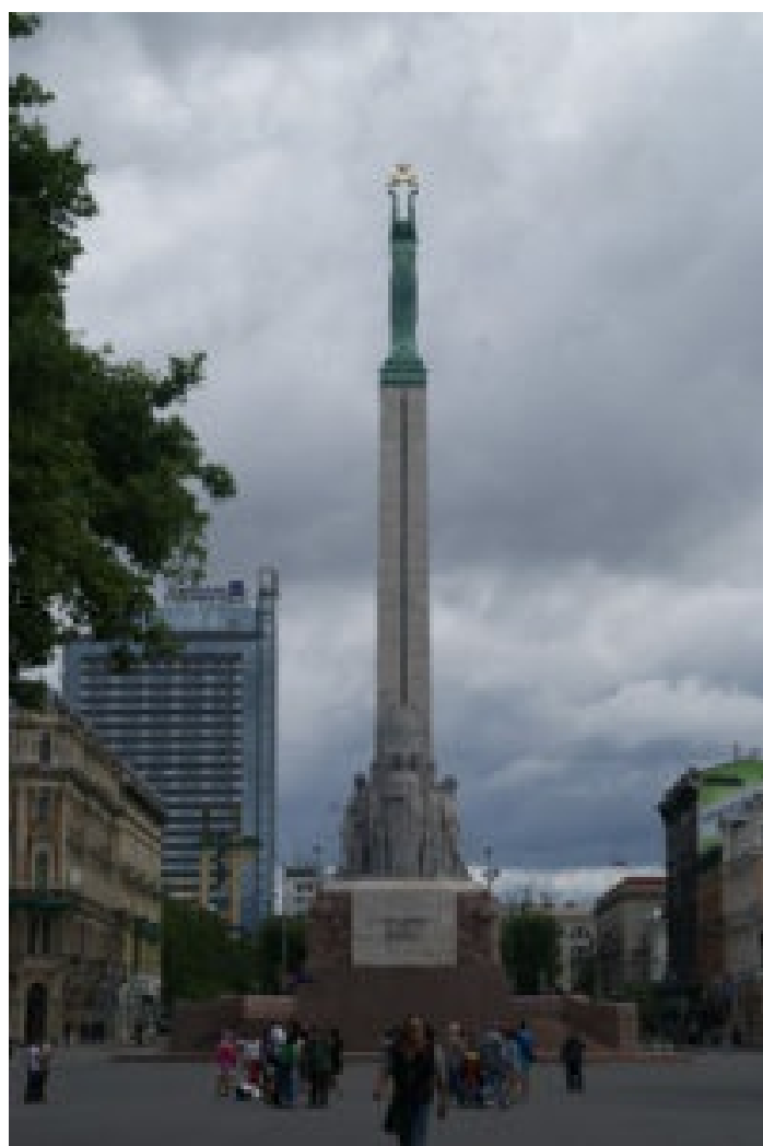
Det 43 meter høje frihedsmonument i Riga er et af de få, som overlevede den sovjetiske besættelse/befrielse.

Sådan gik der 20 år. Men i en hemmelig tillægsprotokol til den tysk- sovjetiske ikke-angrebspagt fra 1939 delte de to stormagter Østeuropa imellem sig. I 1940 besatte Den Røde Hær de baltiske lande, og de blev indlemmet som republikker i Sovjetunionen.