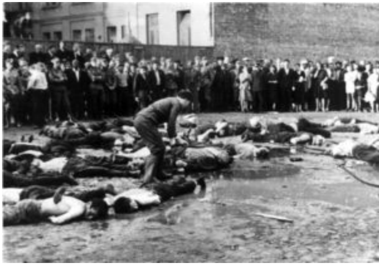
Massakren ved Lietūkis garage den 27. juni 1941 er veldokumenteret både med fotos og øjenvidneberetninger. En af de litauiske mænd slår en jøde ihjel med en jernstang.

I 1944 fordrev Den Røde Hær tyskerne fra Estland, Letland og Litauen. I sovjetisk historieskrivning tales der om befrielsen af de tre lande, der igen blev indlemmet som republikker i Sovjetunionen. Især for Stalin, men også for senere sovjetiske magthavere skulle unionens republikker udgøre et socialistisk/kommunistisk fællesskab. Derfor måtte de nationale identiteter og kulturer bekæmpes. Særligt under Stalin blev særdeles brutale metoder som folkeforflytninger og hårde straffe taget i brug. Nationale mindesmærker, monumenter og mindesmærker blev fjernet, og institutioner og foreninger blev omorganiseret efter sovjetisk forbillede. Af de mere fredelige metoder til at opbygge forestillingen om et socialistisk fællesskab var opstilling af tusindvis af statuer og relieffer i varieret størrelse af Marx, Lenin, Stalin og andre socialistiske/kommunistiske koryfæer og helte på torve og bygninger i selv den mindste by i de baltiske lande. Næppe havde Estland, Letland og Litauen erklæret sig som selvstændige stater i 1991, før man begyndte at fjerne de sovjetisk inspirerede monumenter og mindesmærker. I dag overlever enkelte på museer.