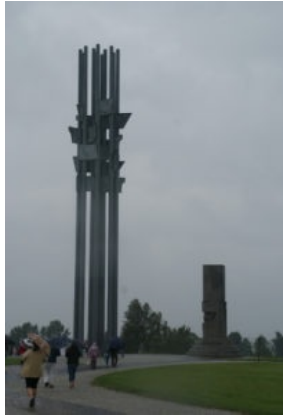
Monumenter på mindepladsen for slaget ved Grunwald i 1410.