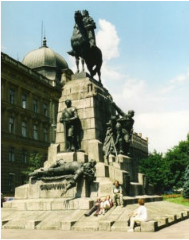
Grunwald-monumentet i Krakow. Rytteren på toppen er den polske konge Władysław Jagiełło. Den dræbte ridder er Ulrich von Jungingen, grand master i Den Tyske Orden.