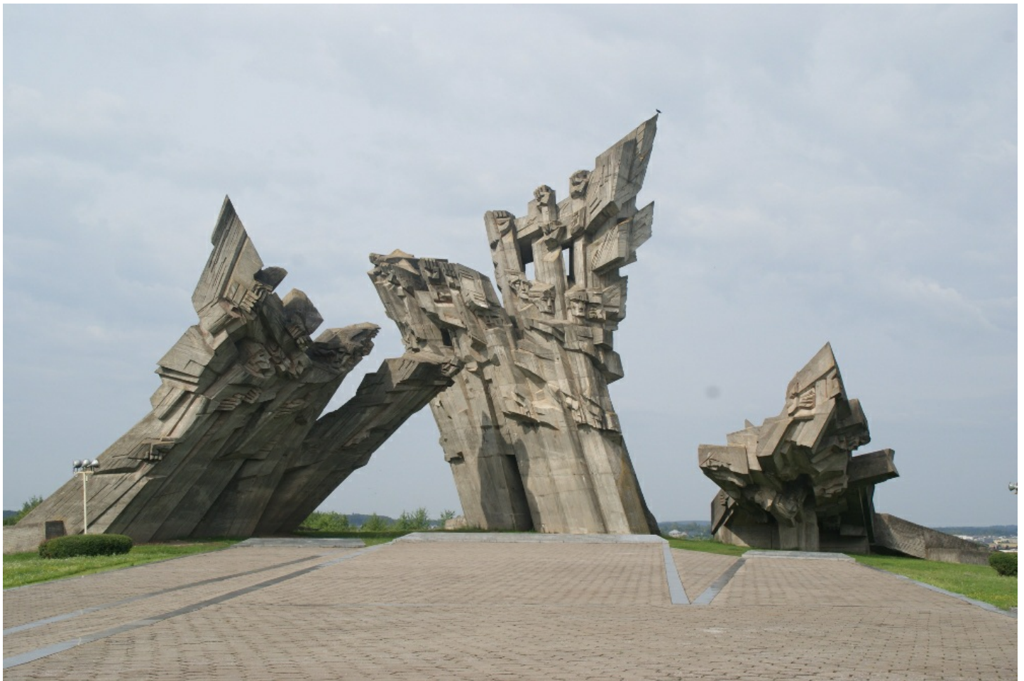
Det 32 meter høje monument for nazismens ofre i Kaunas.

Da Tyskland angreb Sovjetunionen i 1941, så mange baltere de tyske tropper som befriere og satsede på, at de tre lande igen kunne blive uafhængige stater. Titusinder af unge baltere meldte sig i hærenheder, der kæmpede mod Sovjetunionen. Men nazisterne betragtede balterne som en andenrangs race, og de fik ikke deres uafhængighed tilbage, men blev sammen med den sydøstlige del af Polen, Hviderusland, Ukraine og de erobrede dele af Rusland indlemmet i det tyskstyrede Rigskommissariat Ostland. Det var her forfølgelsen af jøder fra begyndelsen var mest intensiv. Således blev 90 % af Litauens oprindeligt ca. 160.000 jøder dræbt.