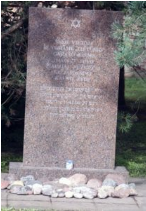
I en baggård står et beskedent mindesmærke over massakren ved Lietūkis garage.