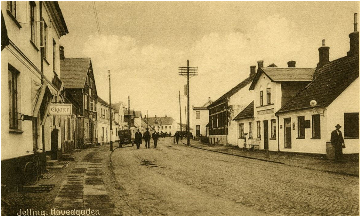
Foto: Gamle fotos og kort kan bruges som kilder til kontinuitet og forandring af nærområdet. Fotoet fra 1930 viser hovedgaden, nu Gormsgade, i Jelling.