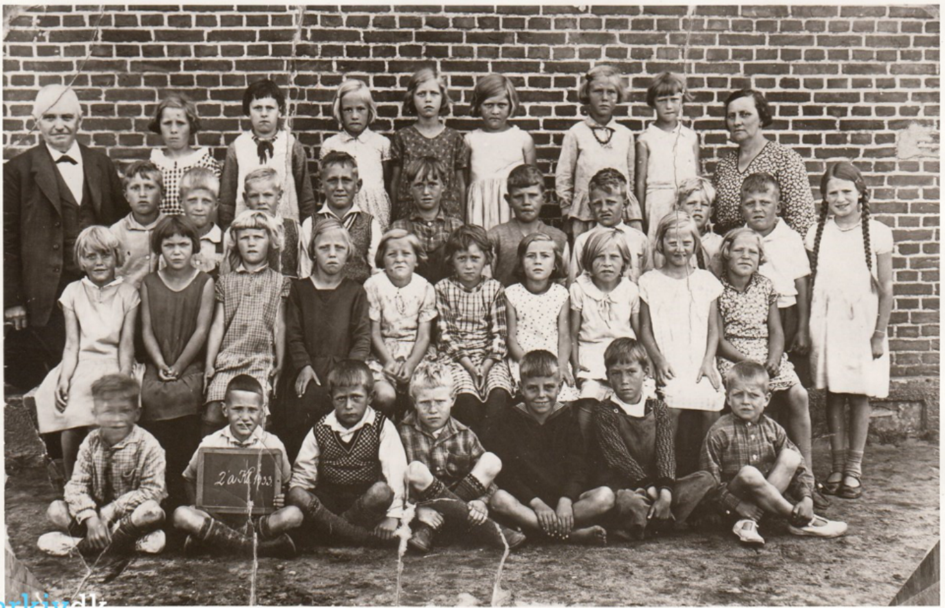
Klassebillede 2a, Nørre Uttrup skole, 1933

Klassebilleder er også historiske spor, der kan bruges som kilder. På en del skoler hænger fotos af afgangsklasser fra forskellige år. Skolen opbevarer måske også gamle klassebilleder, eller de kan skaffes fra det lokalhistoriske arkiv – og i en række tilfælde er de tilgængelige på arkiv.dk. Læreren kan fremstille sæt á 5-7 klassefotos fra forskellige årtier – og fjerne årstallet på billederne. I grupper placerer eleverne billederne i kronologisk rækkefølge. Eleverne skal mundtlig eller skriftlig argumentere for den valgte rækkefølge.