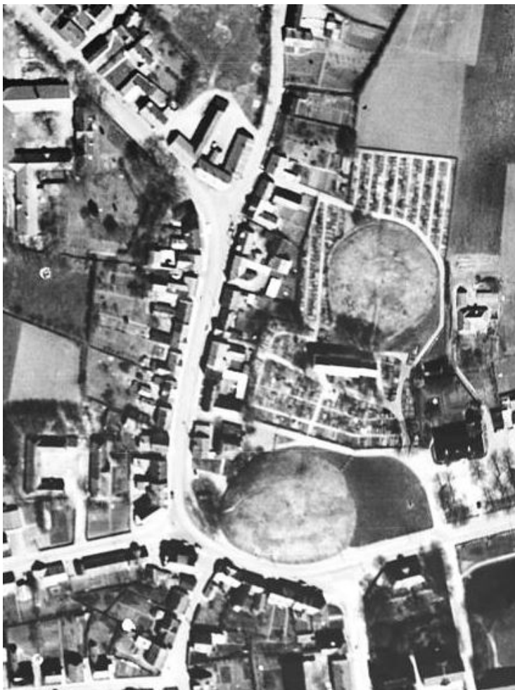
Luftfoto. Gormsgade Jelling 1954.

Via internettet har man nem adgang til historiske kort, som eleverne kan bruge som kilde til ændringer i deres område. Hos Geodatastyrelsen kan man bl.a. søge matrikelkort, sogne og herreds- og købstadskort, og man kan vælge udsnit, der kan forstørres. Umiddelbart er det dog lettest for eleverne at få øje på forandringer ved at bruge Krak.dk . Skriv adressen eller by i søgefeltet øverst til venstre, klik på "Hybrid etc." øverst til højre og vælg "Luftfoto 1954". Så vises luftfotoet fra 1954 sammen med et luftfoto fra 2014. Der kan zoomes og slideren kan flyttes for at studere forandringer 1954 og 2014.