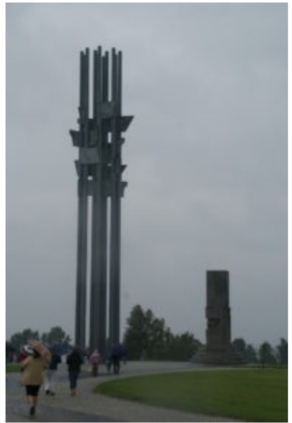
Monumenter på mindepladsen for slaget ved Grunwald i 1410.

Stedet, hvor slaget ved Tannenberg/Grunwald fandt sted i 1410, blev i 1960 omdannet til en mindeplads med monumenter og et museum. I 2010 – 600 år efter slaget – blev der arrangeret et gigantisk reenactment af slaget med flere tusinde deltagere. Det gentages i mindre format hvert år, og det er en fast kutyme, at alle polske skoleklasser som en del af deres historieundervisning besøger mindepladsen. I Klas- Göran Karlssons typologi over historiebrug kan denne praksis karakteriseres som moralsk og politisk-pædagogisk historiebrug (Karlsson 2014, 59ff).