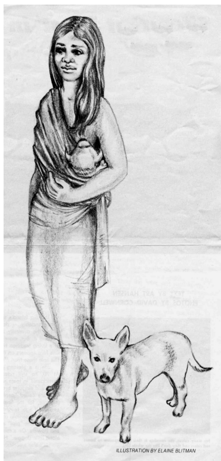
Fig. 2. Hawaiiansk kvinde, der ammer en poi-hund. 2 Illustration af Elaine Blitman (Ramier, 1973)

Der findes også en gammel tradition for hundespising i Polynesien og hovedsageligt på Tahiti, Hawaii og New Zealand. Her blev de opfodret med taro og brødfrugter. Man passede godt på hunden, bar den på skuldrene og i visse tilfælde lagde kvinderne dem til brystet og ammede dem. ”Hunde, der var kæledyr, blev som hvalpe sommetider brystammet. Men en kæledyrshund blev dræbt uden anger, dersom der var brug for den som mad” (Titcomb, 1969). Specielt Tahiti var kendt for sine lækre hunde, og her blev