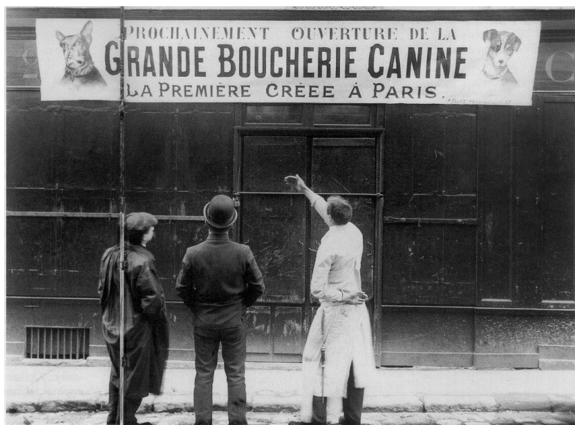
Figur 1. Åbning af den første hundeslagter i Paris i 1910 (Boitani et al, 1997)

Spising af hundekød forekommer i forskellige sociale kontekster: