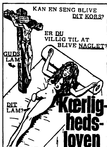
Fra Guds Børns MO-letter.