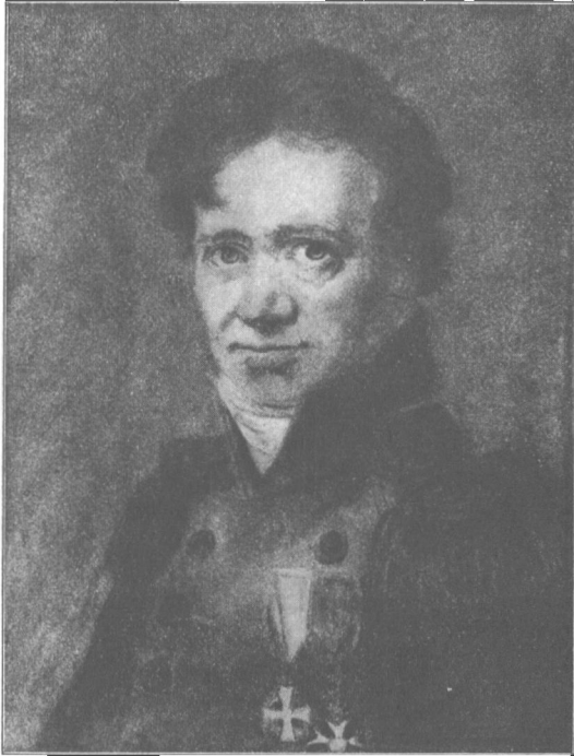
Kontreadmiral Cornelius Wleugel. Efter pastelmaleri (Privateie).

1. Cornelius Wleugel. F. i Kjøbenhavn 16. okt. 1764, blev sjøkadet i 1778, sekondløjtnant i den dansk-norske marine i 1782, premierløjtnant i 1789, kapteinløjtnant i 1796, kaptein i 1803, kommandørkaptein i 1810, kommandør i 1815, og kontreadmiral i 1828. I aarene 1788 til 1791 bistod han sin far med administreringen av orlogshavnen. 1791—94 interimsekvipagemester,