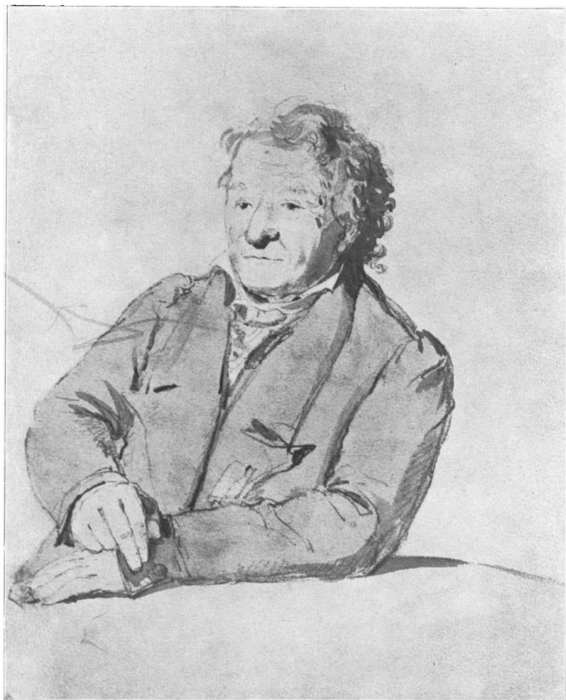
KNUD LYNE RAHBEK.