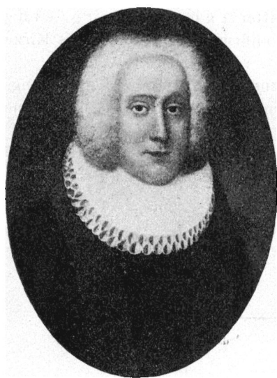
Malt før 1735.