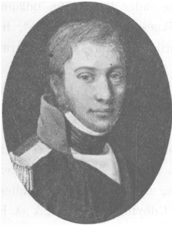
F. L. d'Auchamp, 1776—1847.

François Louis d'Auchamp 1) , født 31. Dec. 1776, kom 1798 til Danmark, anbefalet af Grev Løvendal, der havde kendt ham