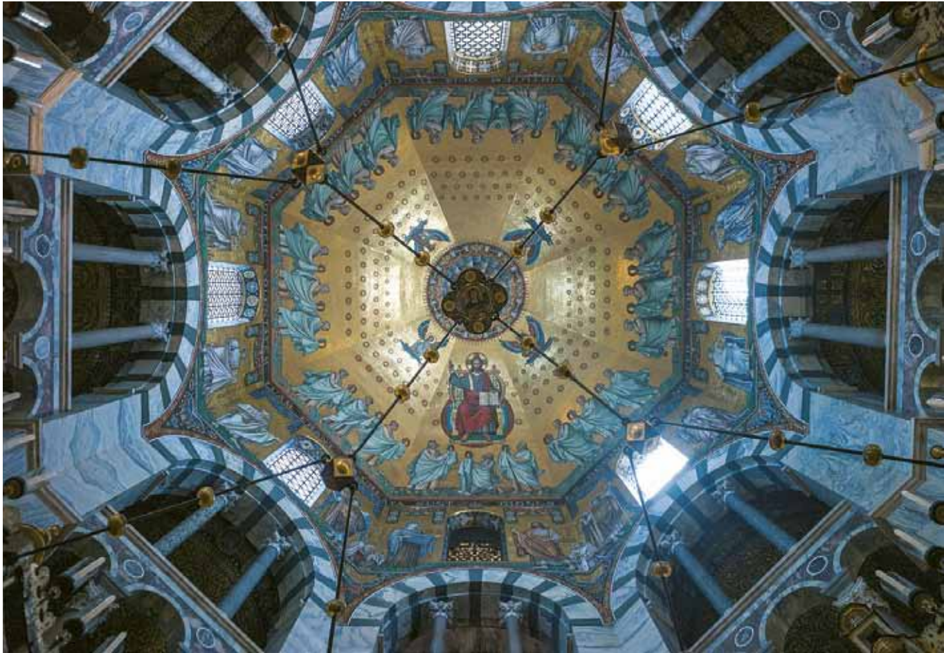
[5] Domkirken i Aachen, interior.

Noe Ecclesiae typus fuit”. 70 Munken Bede Venerabilis (673-735) trækker i sin fortolkning af målene i Salomos Tempel ( De templo ) flere tråde til de kristnes åndelige Kirke. Ifølge 1. Kongebog var templet 60 alen langt, 20 alen bredt og 30 alen højt. I længdemålet står seks for Skabelsen på seks dage og fuldendelsen af gode arbejder. 71 Dets højde [forstået som tre gange ti] symboliserer troen på den hellige Treenighed. 72 Om Templets forhal, 73 som var tyve alen lang og ti alen bred, skriver Bede med henvisning til Josephus’ fortolkning af templet, at solens stråler gik igennem tre døre: indgangsportalen, templet og det allerhelligste, for at lyse på Arken. Og videre forklarer Bede, at eftersom templet betegner den hellige Kirke, hvad kunne være mere passende som type end indgangen, som var