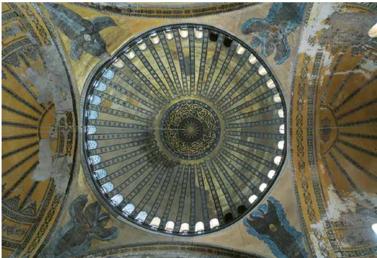
[4] Hagia Sophia, interiør. Kuplen og dens fod.

gengivet en oktogonal bygning, hvis otte søjler omkranser et sekskantet bassin. Ifølge Underwood kan ottetallets betydning følges tilbage til Barnabasbrevet fra 2. årh., hvor ottetallet blev tolket som et symbol på Jesus' opstandelse og begyndelsen på den nye verden. 49 Set i dette perspektiv giver det mening, at man brugte en ottekantet grundplan i et dåbskapel. Underwood inddrager seks- og syvtallet ud fra Augustins sidste tanker om Guds frelserværk i skriftet De Civitate Dei , idet kirkefaderen ser skabelsesberetningens seks dage som et billede på de seks tidsalder, menneskeheden har lagt bag sig, og hvor kun Gud kender afslutningen på den syvende tidsalder. 50 Augustin skildrer denne tidsalder som "den store Sabbat, som ikke har nogen aften." Den efterfølges af den ottende og "evige dag". De tre tal tegner således et drama, hvor syvtallet binder det første og sidste sammen. Tal-figuren syv kunne også henvise til de baptisterier, hvor der i oldkirken var syv nedstigningstrin. 51