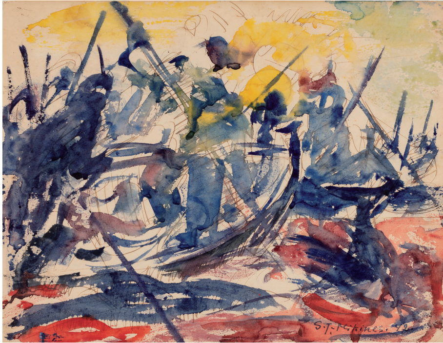
[3] Sámal Joensen-Mikines: Grindedráb (Grindadráp), 1942. Vatnlitir, pennur, brúnt blekk, 24.7 x 31.8 cm. SMK.