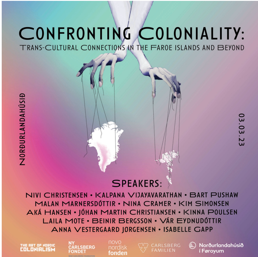
[5] Laila Mote: plakat til seminarið Confronting Coloniality , 2023. © Laila Mote.

staðið til seminarið Confronting Coloniality: Trans-Cultural Connections in the Faroe Islands and Beyond [5], sum var fyriskipað av fleiri av ritstjórunum og høvundunum í hesi serútgávu. 11 Seminarið var í Norðurlandahúsinum í mars 2023 og bjóðaði røðarum og luttakarum at samrøðast um møguleikarnar og avmarkingarnar hjá Føroyum sum eitt byrjaðarstað fyri spurningar umkring kolonialismu, kolonialitet og list. Í nógvar mátar hevur seminarið verið við til at seta saman hesa serútgávuna av Periskop .