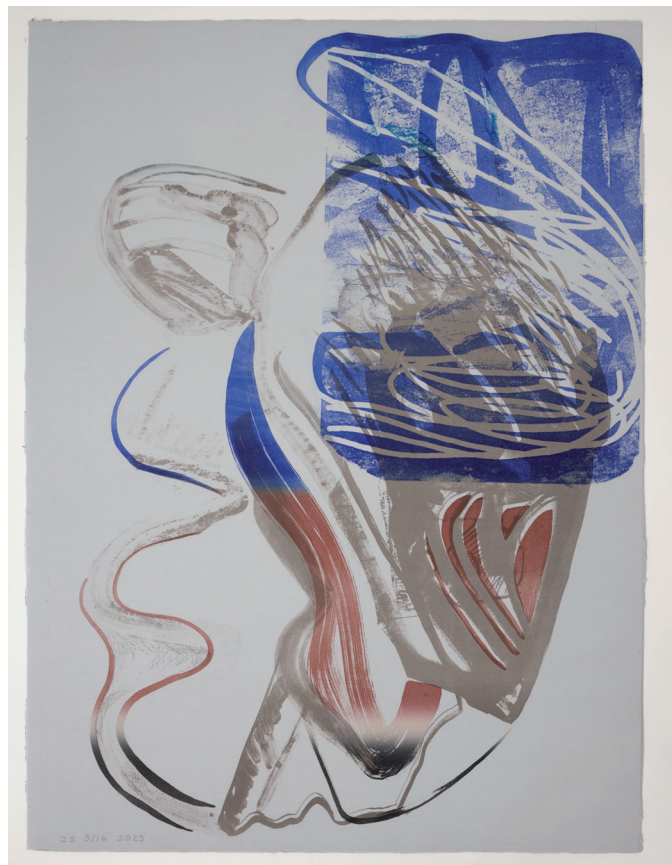
^ Hansina Iversen: Sepia , 2017. Steinprent gjørt í Steinprent. © Hansina Iversen.