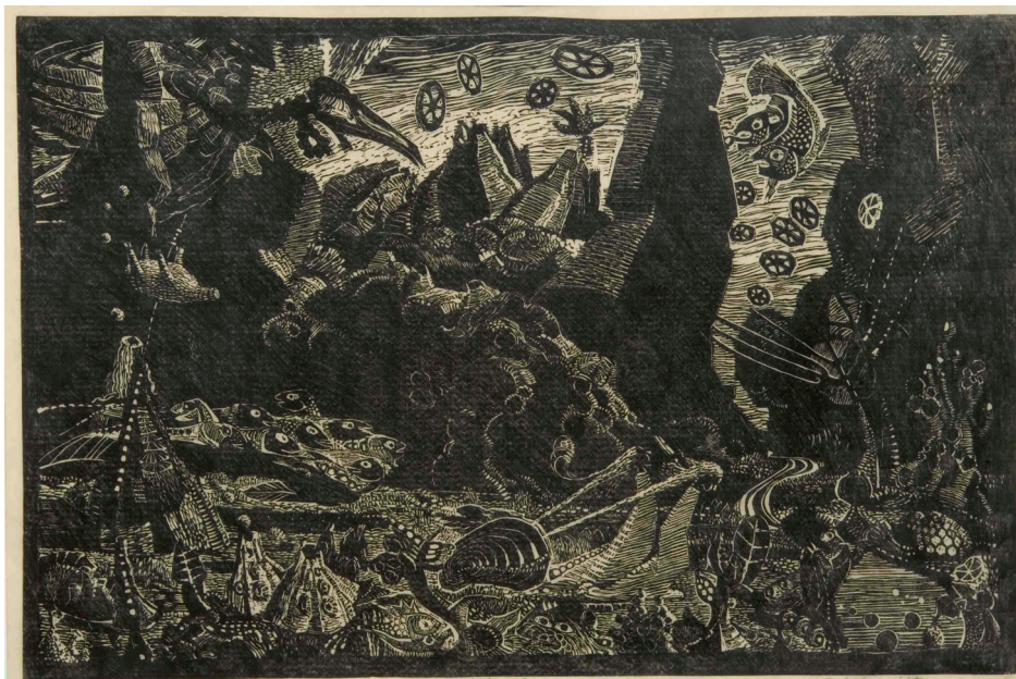
[2] Elinborg Lützen: Ævintýrmynd II , 1973. Linoleumsprent, 42 x 63 cm. Listasavn Føroya.

prentunum. Í nógvum av prentum sínum brúkti Lützen bara heilt lítið av svertu fyri at fáa prentini grá heldur enn heilt svart. Henda effektin kom eisini til sjóndar, av tí at listakvinnan nýtti eina skeið úr horni fyri at føra prentið yvir á pappír, heldur enn at nýta eina prentressu. Hetta gjørdi arbeiðstilgongdina langa og strævna og úrslitaði eisini í, at eitt rættiliga avmarkað tal av eintøkum varð gjørt av prentunum, oftast 10-20 eintøk (Jákupsson 2019, 14). Tað er vert at nevna, at skeiðin hjá Elinborg Lützen, umframt tað mesta av prentingarútgerð hennara og fleiri linoleumsstokkar, skitsubøkur og uppritsbøkur vórðu latin Listasavni Føroya og eru at finna í goymsluni hjá savninum.