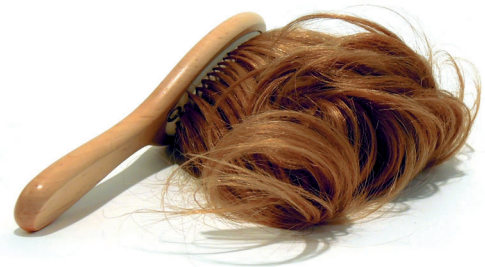
[4] BLESS Beauty Hairbrush, 1999, 2024.