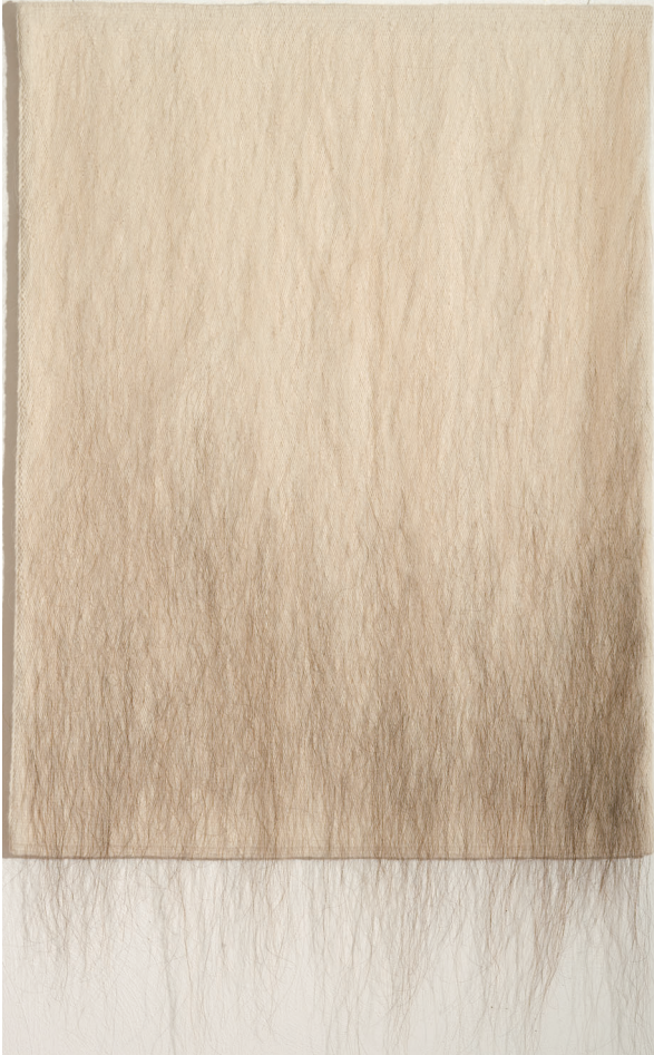
I Tita Vinther: Sirm , 1993. Ull og hestahár, 127 x 96 cm. Listasavn Føroya.

siðbundnir listamiðlar verða settir javnt við list. Til dømis Dagmar Warming (2006, 14) skrivaði um royndirnar hjá Vinther við menniskjahári, “hon vevur ikki eitt lørift – eina mynd í tveimum dimensjónum – men ein skulptur í trimum dimensjónum.” Hóast hendan lýsingin fangar nøkur lykklahugtøk í site-responsive-verkætlanunum hjá Vinther, so forðar hon okkum í at skilja veving sum sína egnu listagrein, tí hon leggur upp til at síggja tekstilu