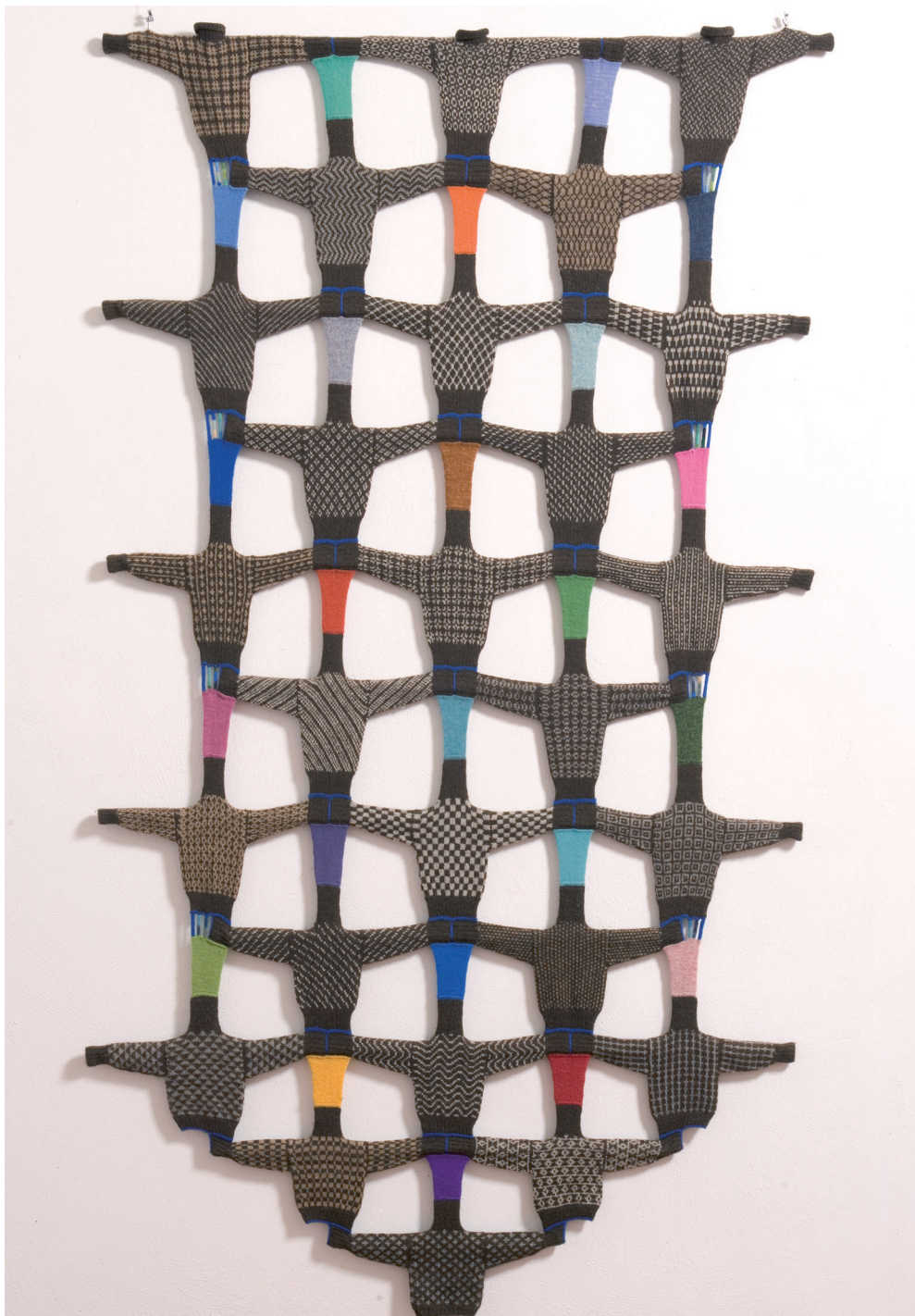
[1] Astrid Andreasen: Baby Boom , 1997. Bundnar ulltroyg- jur, 258 x 159 cm. Listasavn Føroya. © Astrid Andreasen.