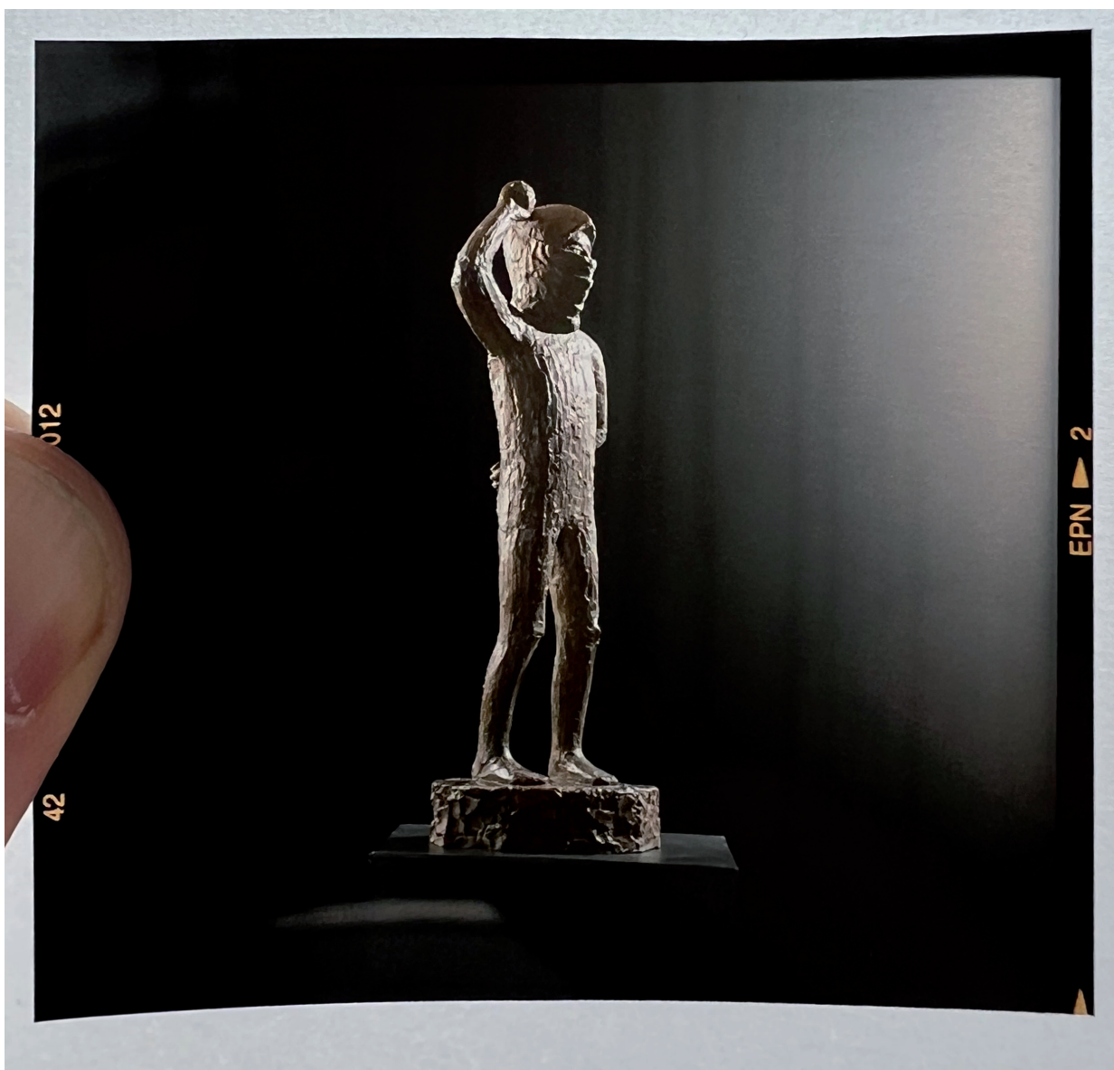
Janus Kamban: ókent heiti (protestfigurur), 1980unum. Foto: Ole Wich, avmyndað av Jóhan Martin Christiansen.