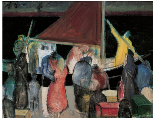
[5] Sámali Joensen-Mikines: Skipini fara ein várdag , 1937. Listasavn Føroya.