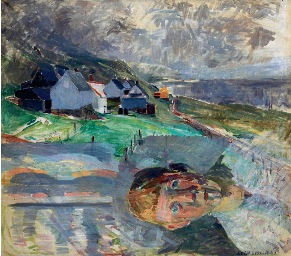
[1] Ruth Smith: Andlit-smynd Leif/Nes , 1957-8. Olja á lørift, 70 x 79 cm. Listasavn Føroya, Tórshavn.

myndum.“ Hóast hesar frágreiðingar eru sannlíkar, hava tær ongantíð fult nøktað mína fatan av verkunum eftir Smith. Tá eg fór ígjøgnum katalogið hjá Smith, blivu hesar frágreiðingarnar minni og minni sannførandi.